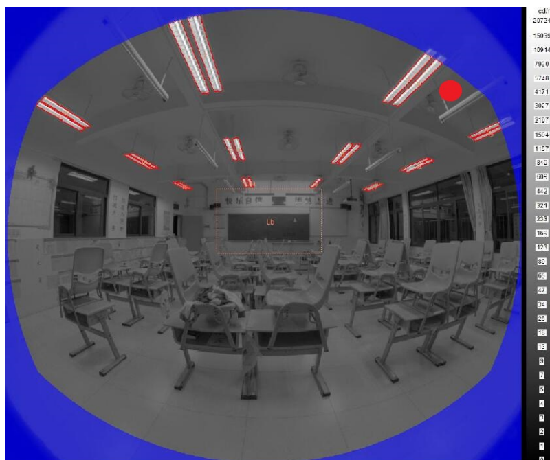
Figure 2. UGR measurement scenario 图 2. UGR 测量场景

为原点的坐标系, 假定视线水平, R 是灯具中心与观察者眼睛的距离在视线的投影距离, T 是灯具与观察者在水平方向的偏移量, H 是灯具高于观察者眼睛的高度)。为了分析畸变的极限影响, 我们选取畸变最大的地方, 即图 2 中 UGR 分析区域右上角红色部分, 这个点 T/R = 3 , H/R = 1.9 , P = 16 。畸变后测量的 T'/R' 、 H'/R' 值比真实值偏小, 查 Guth 位置指数表[4], 得到位置指数的测量值 P' , 代入公式(1)计算可得 UGR 结果误差, 如表 5 所示: