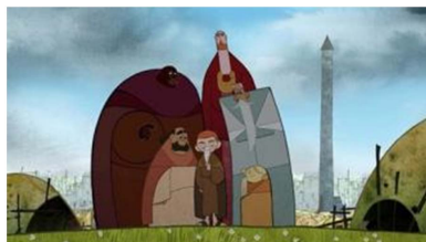
Figure 1. Character geometry design

《凯尔经的秘密》最突出的风格在于其角色和场景的几何形设计，画面无任何透视上的变化，却塑造了深刻的人物形象。如布兰登的人物角色头部接近于正圆形，耳朵则是半椭圆形；修道院的院长其头顶为圆弧形，身子则由等边三角形和长方形构成；强盗的角色设计以矩形为主，头部和身子为矩形的规律变化；其他角色设计也主要运用圆形、三角形、四边形等基本几何图形(图 1)。几何形的灵活运用，塑造了不同个性的人物角色，造型夸张简洁，一个个性格鲜明的人物活跃于屏幕上。以圆形为主的布兰登和阿斯琳，可爱单纯，两个小主人公善良勇敢，圆形的运用，使其性格更加明显；三角形和长方形在院长身上的运用，体现了他刻板严肃的性格，固守传统，不易变通；维京人的矩形设计，象征了其邪恶、凶残的性格，矩形的身子和三角形的五官，体现了其冷酷无情的性格。