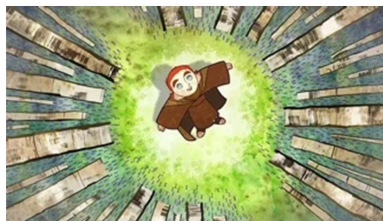
Figure 2. Scene geometry design 图2. 场景几何设计

同样几何形在其作品中场景设计中的运用也尤为突出，大面积几何形的运用，突出画面的完整性，给人以极大的视觉冲击力，印象深刻。《凯尔经的秘密》中较大的场景都以几何形呈现，例如布兰登和艾丹一起绘制经书的一个场景，半圆形的圆弧构成了房间。不断重复的圆弧墙壁则点缀了无数小圆，圆形的使用既塑造了梦幻的场景，又增加了其肌理效果。影片中还有一处经典的俯镜头，既布兰登在森林中迷路的一幕，四周树木围成一个正圆，将布兰登困在中间(图2)。此处圆形的使用增加了森林的神秘色彩，同时激起了布兰登对森林的好奇心，层层铺垫之下，更好的引出故事，也反映出“神为中心，泽及四方”的哲学思想内涵。