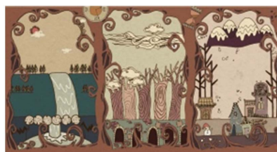
Figure 5. Journey scene design

个人作品《旅程》的场景设计中则较多的使用装饰性线条，特别是对场景架构的肌理和结构塑造中，几乎全部采用线条。例如短片中主人公走过四季变换的时候，显示时间流动性的一个场景，外围运用了曲线作为装饰性线条(图5)。场景外轮廓曲线的运用体现了主人翁的成长及旅程时间的变迁，场景内的树木、云朵、房屋都采用曲线塑造，描绘出了一个充满童趣的美丽世界，暗含了这个小世界中浓浓的爱意；再如旅程中樱花大道的呈现，无数颗樱花盛开在道路两侧，樱花花瓣采用密铺的方式，树干则运用手绘的细直线去塑造其肌理。勾勒了一条美轮美奂的道路，既呈现了沿途的美景，也暗示主人公内心做好事后果然自然对她的“表扬”(图6)。