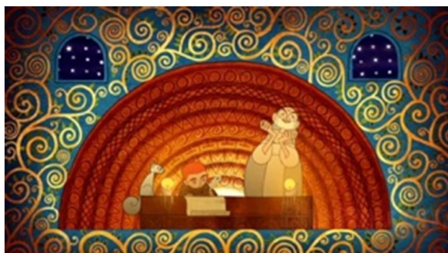
Figure 4. Scene line design 图 4. 场景线条设计

线条既构成了造型的形态，同时又通过反复、旋转、扭曲、变形等形成不同的肌理，增加造型的质感，表现角色的结构。直线的运用给人以冷静理智的感受，曲线的运用则给人以温柔梦幻的感受。对线条规律灵活的运用，可以产生节奏感和韵律美，是装饰性元素的组成单位之一。