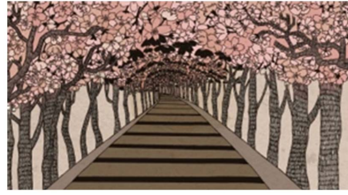
Figure 6. Journey scene design 图 6. 旅程场景设计

装饰性元素在动画作品中的成功运用对动画作品的表现形式具有突出贡献，对动画作品多样性的拓展和创新，具有积极的指导意义和实用价值。中华民族文化中不乏优秀的装饰性元素，我们在动画创作中应积极借鉴传统文化，一方面将传统艺术形式运用到动画作品中，例如：国画、戏剧、壁画等等装饰性元素，将传统与现代相结合，创造新的艺术形象；另一方面将我们的民族精神运用到动画作品中，例如：忠孝仁义、勤学好问、勤俭节约等优秀传统美德运用到动画创作中去，让动画艺术更好的服务人民。