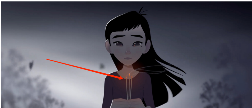
Figure 4. Incense offering 图 4. 上香祭奠