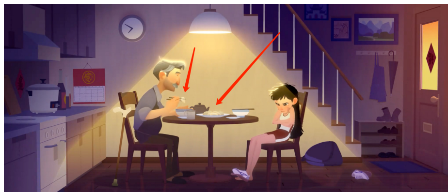
Figure 3. Dumpling display 图 3. 饺子展示

另一情节便是图 4 中上香的情节，中国人祭奠去世的亲人都会有这一仪式，是对故去亲人的追悼及祭奠。此处情节整体的色调为暗调，唯独璐娜手中的三根香散发着微弱的红光，是推动故事情节发展的重要元素，也是传递民族性的重要表征。