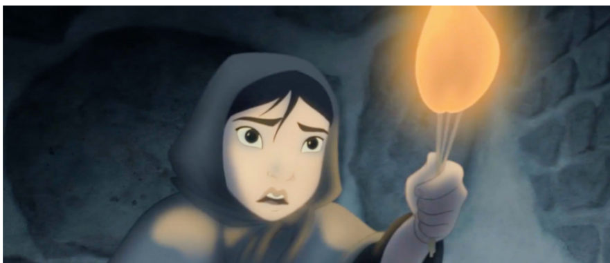
Figure 5. The image of a little girl selling matches 图 5. 卖火柴小女孩形象

首先是女儿形象的建构。从外部形象表征来看，女儿的形象更像是迪士尼动画《卖火柴的小女孩》中小女孩的视觉形象，小女孩和周围人物相比，其实是亚裔的形象表征，如图 5、图 6。从内部形象建构来看，璐娜的形象更像是中国首位女航天员刘洋，从小努力学习奋斗，依靠自身的努力获得了这份荣誉，其身上坚强、拼搏、刚毅的品质更像是中华民族伟大的缩影。