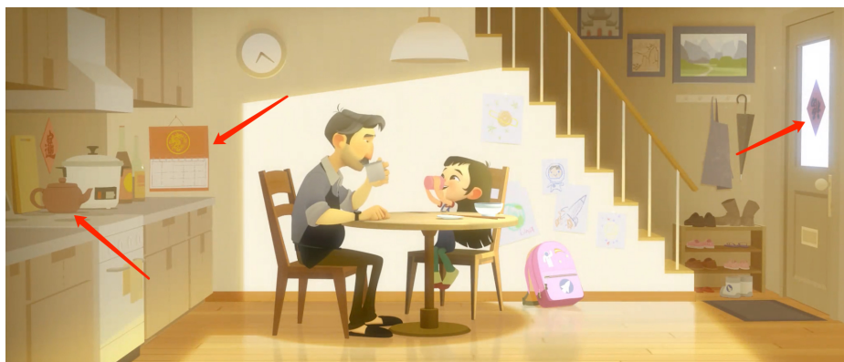
Figure 1. Living room props 图 1. 客厅道具