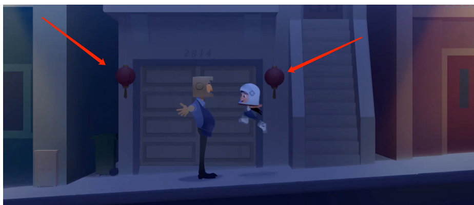
Figure 2. Lantern shape 图 2. 灯笼造型