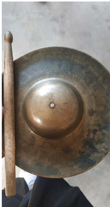
Figure 5. Small cymbals