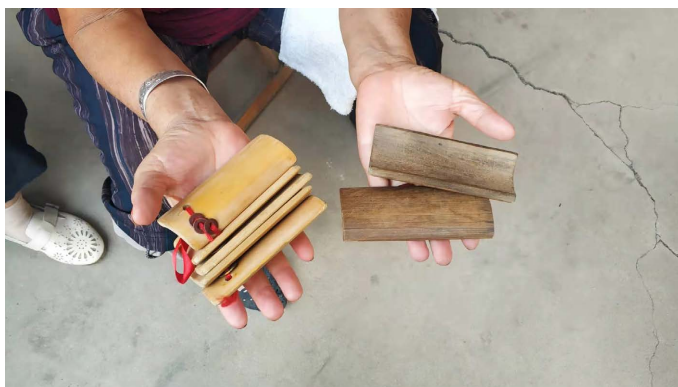
Figure 4. Section board 图 4. 节板

扬琴, 二胡旋律性比较强, 节板, 小钹节奏性强, 可以更加丰富聊城八角鼓(见图 4 所示)(见图 5 所示)。