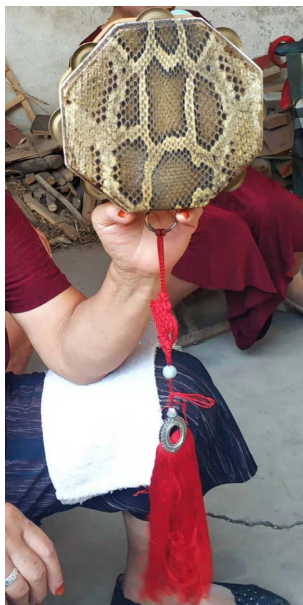
Figure 3. Octagonal drum 图 3. 八角鼓

八角鼓, 因鼓身有八个角而得名, 也叫单鼓。鼓身小巧, 鼓面呈八角形, 代表当时清朝的八旗。单面蒙皮, 有蟒皮, 驴皮或马皮, 一般是蟒皮。鼓框是用八块木头拼接而成, 材料多为檀木, 乌木, 梨木, 面框内镶嵌着两三枚小铜钹, 剩余一面的框板上系着一个红色花结, 花结下垂着两根长穗, 寓意着五谷丰登, 象征着丰收(见图 3 所示)。