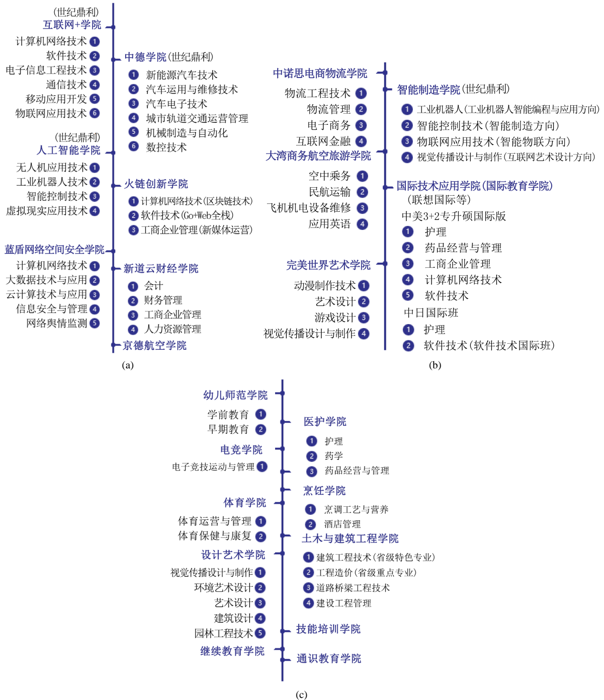
Figure 1. School and Enterprise Cooperation College and Professional Distribution of Sichuan Vocational College of Science and Technology

在开展为企业进行的定制培养、订单培养，这对同产业人才需求培养奠定了宽泛基础。同时，从图 1 的专业设置中也可以清晰的表明，即使同一专业名称，但由于合作企业不同，故此在人才培养的专业技能方向上也有不同的侧重点。各校企合作二级学院对学生的培养，引入了各自企业的所属产业行业，其影响力广，技能专项性强，就业渠道畅通。