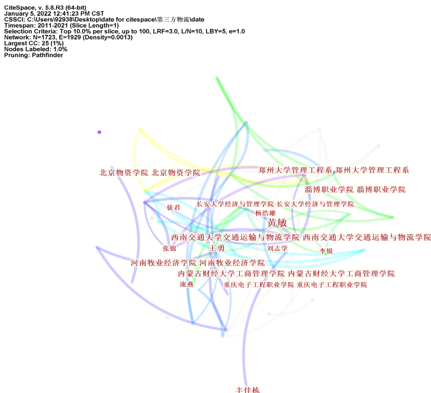
Figure 1. Graph of third-party logistics research authors and institutional cooperation

计 90 篇文章，占近十年第三方物流核心期刊文章总数的 9.8%。如图显示机构连线较少，表明机构间的合作较少，第三方物流研究领域的学术合作还远远不够，大部分以独立为主。因此，鼓励来自不同机构的学者之间加强学术合作，以分享相关知识和经验，对进一步推进第三方物流研究至关重要。