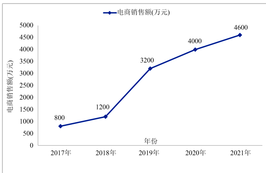
Figure 2. The development trend of e-commerce economy in Haiqian Village in the past five years 图2. 近五年海前村电商经济发展趋势 2

海前村东临黄海,耕地滩涂等土地资源占比较大。电商产业出现前,该村以发展种植业、捕捞业等第一产业为主。近年来,海前村党组织依托海头综合市场的优势资源,创新组织结构,率先成立电商党支部,以“党建+电商”模式推动村民创业致富。全村现有电商户383家,党员带动就业人数共计3600余人,电商发展趋势向好(见图2)。“渔网连上互联网,支部织出新富路。”可谓是对海前村实现蝶变的精准概括。