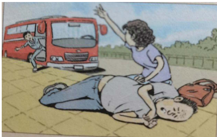
Figure 3. The passenger saves an old man 图 3. 乘客救了一位老人

也要采取恰当的方式, 根据自己的实际情况施救, 与此同时还能不断丰富其批判性思维。