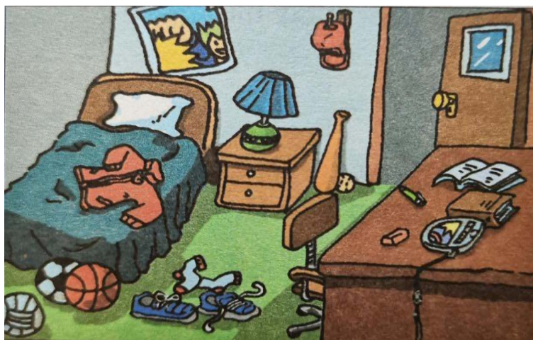
Figure 4. Bedroom 图 4. 卧室

如图 4, 在人教版初中英语七年级上册 Unit 5 Do you have a soccer ball? Grammar Focus 这部分内容结束后, 首先教师可以让学生仔细观察 1c 的插图, 然后根据插图内容复现今天所学内容; 然后教师引导学生大胆思考, 不仅局限于插图内容, 让他们与同学集思广益并分组讨论插图中的房间整洁与否? 是男孩的房间还是女孩的房间? 房间门为什么是开着的? 等问题引发学生对插图的思考, 调动学生的积极性, 这时学生是课堂的主体, 教师要留给学生足够的思考时间和空间。最后教师可以借插图布置一个有趣的家庭作业: 让学生根据插图, 结合实际生活, 发挥想象, 画出自己的理想中的卧室, 然后根据自己的画编对话并表演。总之, 教师可以利用插图留白让学生发挥想象, 在提高其语言输出能力的同时, 培养其创造性思维。