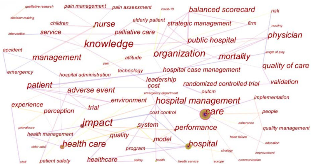
Figure 2. Knowledge map of keyword hotspots in hospital management research

家的医院管理都面临着两大难题,即入口步入老龄化和医疗保险制度的改革[4] [5]。对此国外医院采取了一系列富有成效的管理举措。比如调整医疗服务结构、注重医疗水平和专业化程度的提高等。