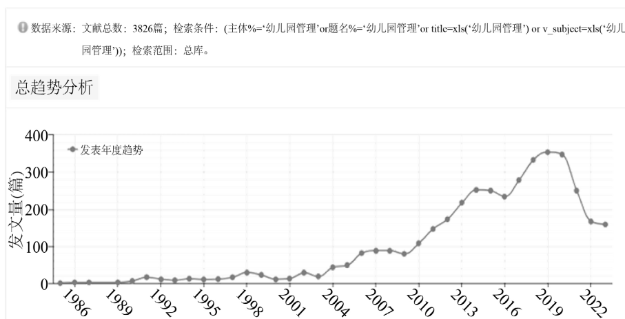
Figure 1. The distribution of the number of research literature on kindergarten management in CNKI

从图1，可以看出知网关于幼儿园管理相关研究从1985~2019年呈现逐步上升趋势，自2019年至今，相关研究呈现下降趋势。作为一款引文可视化工具，Cite Space旨在挖掘文献背后的潜在知识、梳理文献引用之间的联系和把握文献的发展趋势。本研究尝试运用CiteSpace6.1.R2软件作为研究工具，以中文社会科学引文索引作为数据来源，根据样本数据检测发现，该领域第一篇“幼儿园管理”相关期刊论文发表于1985年，结合检索文献整体情况，最终确立1985~2023年为文献来源时段。检索式为：“篇名(词)=(‘幼儿园管理’)or 关键词=(‘幼儿园管理’)and 文献类型=‘论文’and 年=‘1985~2023’”，结果共得到3826篇期刊文献。为了最大可能排除不相关文献干扰，保证研究可信度，本研究借助CiteSpace6.1.R2软件对文献题目进行格式标准化，去除重复文献和不相关文献后最终保留500篇文献作为本研究的分析样本。