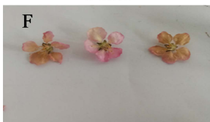
Figure 3. Drying effect on 60 drying firepower 图 3. 60 火力时的干燥效果

由表 6 可以看出，干燥火力为 60 时，榆叶梅花干燥不同时间的失水量及得分情况。