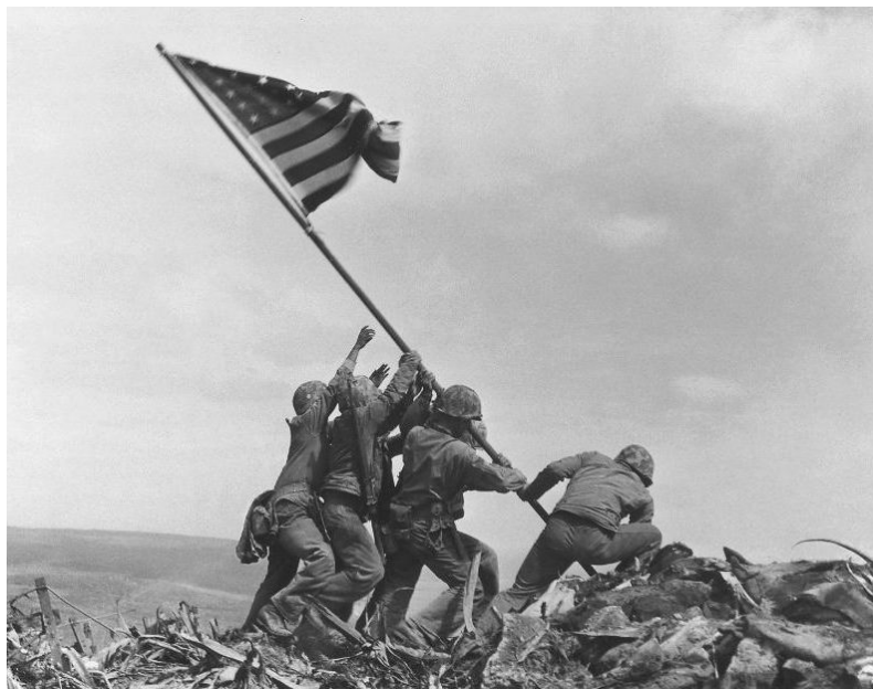
Figure 1. Photography “Battle of Sulfur”

首先,城市设计不能脱离功能、经济、社会、人文等方面,避免犯“就形态论形态”的错误。主题理念的“广义性”,主要指辩证看待城市设计的物质形态和综合社会两方面,要通过物质形态设计,解决当前普遍存在的功能,甚至经济社会问题。