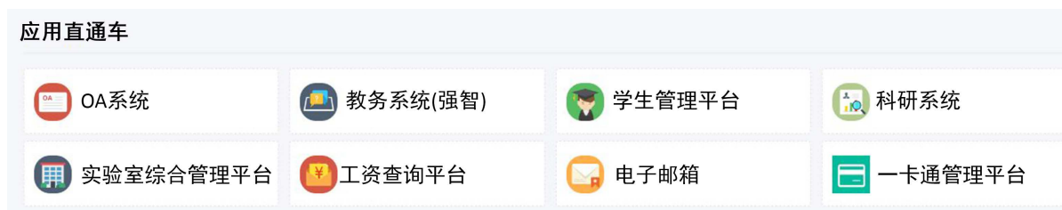
Figure 2. Docking business systems

统一身份认证平台和企业微信三套账号已经相互关联绑定完成。已对接的业务系统如图 2 所示。