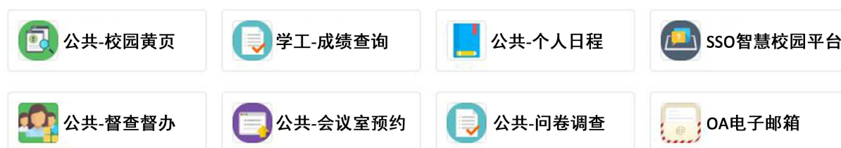
Figure 3. An app that has been created

以企业微信为移动端应用底座, 把业务系统移动端应用一个个插入到企业微信。利用企业微信的自定义应用功能创建业务系统移动端应用。应用创建成功后, 把业务系统对应的移动端 H5 页面配置为应用的主页或者菜单。应用创建成功后, 显示在企业微信的工作台中, 每个应用都是单独工作, 互不影响。企业微信还提供微信插件, 师生扫码关注后, 可以直接在微信中使用这些应用, 其体验效果与在企业微信完全一样。已创建的应用如图 3 所示。