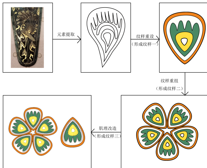
Figure 4. Design effect of pattern 图 4. 纹样设计效果图