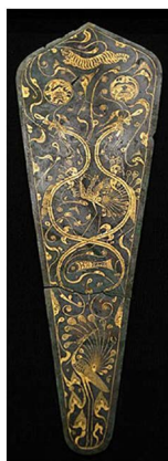
Figure 1. Bronze inlaid with gold Danglu

海昏侯墓出土的“当卢”有 80 多件, 这些当卢的外形和材质多种多样, 有圆形、圆叶形、尖叶形和长叶形四种形状, 也有银、铜、错金三种材质[2]。形状不同的当卢上都装饰有山羊、朱雀等不同的图案, 纹饰最丰富、精美的当属三件青铜错金当卢, 它们的整体造型并不大, 呈尖叶形。其中一件青铜错金当卢的正面大约篆刻有八种精美的动物图案(图 1), 如青龙纹、白虎纹、朱雀纹、玄鱼纹、玉兔纹、蟾蜍纹、金乌纹、凤鸟纹等吉祥纹样, 在动物纹样周围篆刻线条飞舞的云气纹与卷草纹, 粗细不均却生动活泼。据史料记载, 汉代贵重物品上通常根据主人的身份地位绘制着不同的纹饰, 它们不仅有装饰、美化的作用, 还隐含着十分重要的象征性和示意性。海昏侯墓当卢以纹样直观图为主, 构成有层次、有内涵的理想化图案。为了便于说明, 笔者对朱雀纹和凤鸟纹加以提炼并绘制出来。