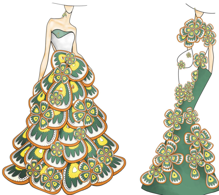
Figure 6. Design effect of dress

所以礼服的局部也运用绿色与纹样色彩相呼应。礼服的面料选择, 可选用华丽高贵的丝绒, 丝绒面料手感光滑柔顺, 色泽柔和亮丽, 具有极好的悬垂感。将创新纹样运用在礼服中, 既美化了礼服的外在形式, 又起到了丰富礼服内涵的作用, 使传统文化得以传播从而被认同。