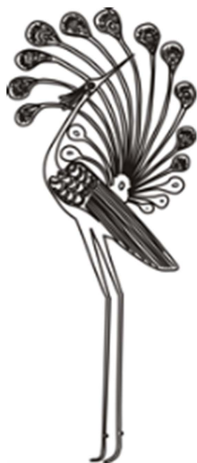
Figure 3. Rosefinch pattern