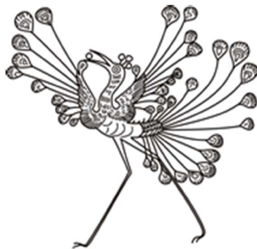
Figure 2. Phoenix pattern