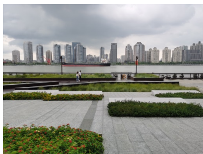
Figure 8. Yangpu Waterfront Section A: Floodwall

杨浦滨江重要部分的防汛墙(见图 8)作为代表性特征物被保留了近三百米,斑斑锈迹的钢质拴船桩和系缆桩通过多种施工工艺的复原在新场地中再焕生机,达成了老码头原有肌理的留存与提升。广场上大小不一的船锚(见图 9)错落排列呈船头阵型,斑驳的饰面和凹凸不平的触感映射出往昔工业码头的繁忙景象。装置了仪表盘的长条凳、工业风格的垃圾桶都是场地对时间最真实生动的映射,也是历史连续不断叠加的过程。设计者像串珍珠一样把这些有故事有年头的旧物件串联起来,形成新的场所空间,让工业文明在时间的厚度中延续。