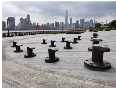
Figure 9. Yangpu Waterfront Section A: Boat anchor