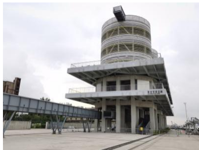
Figure 7. Yangpu Waterfront Section C: “Ash Gallery” scenic spot in Yangtszepoo Power Plant Relic Park