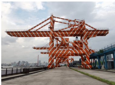
Figure 1. Yangpu Waterfront Section C: Set of diagonals for cranes