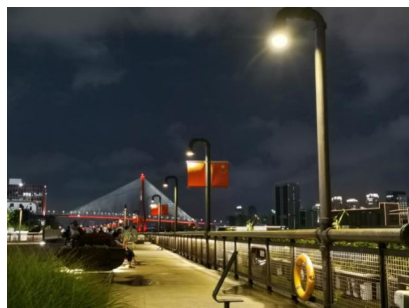
Figure 12. Yangpu Waterfront Section A: Water pipe lamp sequence

人在与空间的互动中, 对整体空间的认知常取决于空间形态中的某些细节, 并由此形成对环境的情境认知。例如“杨浦专有”的标志性景观 - 水管灯序列(见图 12)就颇具艺术感染力和观赏性, 得到了众多体验者的追捧。通常工业管道里流淌的是大量的液体, 通过设计改造, 光束顺着管道倾泻在地面上, 照亮了新的公共空间。从流淌水来保障民生到流淌各种工业液体加速城市发展, 最后流淌光照亮新的滨江岸线, 设计者是以“叠加的原真”为态度介入设计的。在水管灯上人们不仅可以看到不同年代的叠合印记, 也为其生命得以更好的延续而百感交集。