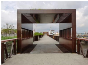
Figure 3. Yangpu Waterfront Section C: Plank road pavilion