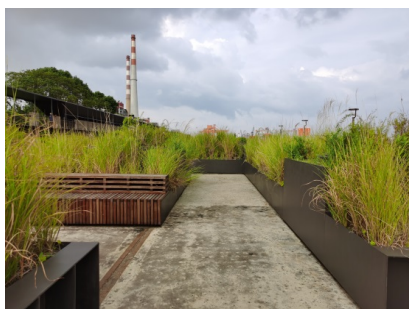
Figure 10. Yangpu Waterfront Section C: Ecological wilderness

阿米尔说：“一片自然风景就是一种心情” [8]。在当下，情感与景致是脉脉相通、和谐共生的。由物至心，不同的景物给人的感受和反应各不相同，也影响着体验者在空间所体现的精神气质及心理状态。好的景观设计在美学上表现为景动心摇、物我交感。工业遗存的景观意境构成方式尽管各不相同，但在设计意蕴中包含的心物关系不可小觑。古诗的美学内涵在于文学创作中的心、物关系，诗人在创作前要先具备审美注意并由此运思取境，诗歌的美学规律同样在工业景观情境化设计中适用。