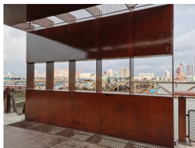
Figure 4. Yangpu Waterfront Section C: En-framed scenery in the pavilion plank road