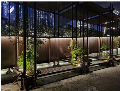
Figure 11. Yangpu Waterfront Section A: Mills corridor