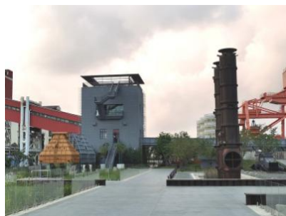
Figure 5. Yangpu Waterfront Section C: Full view of Yangtszepoo Power Plant Relic Park

同时，杨浦滨江利用景观情境化设计实现了“工业锈带”的成功转型，与其他滨江条带做法不同的是，它其间设置的每一处情境空间与元素均指向明确，娓娓道来其沿江纵深方向大片工业遗存的历史与发展，并通过不同的契形绿地深入腹地，用深意巧思和精工匠心串联起滨江与城市空间的过去与未来。