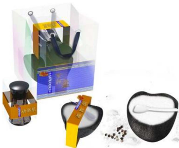
Figure 3. Product packaging modeling 图3. 产品包装建模

在选择装饰元素设计上,将皇家贡品叙事语境相关限定原则作为系谱轴,本土原生环境的海云纹、黄、蓝色等传统文化象征符号作为毗邻轴,对设计元素的节奏和韵律调和,形成具有广泛文化基础的海岛风格和皇家贡品特征的仪式化元素文本库,以强调非遗海盐晒制技艺仪式化表征特点。从元素文本库中挑选素材进行产品包装设计,建模(如图3所示)并打样制作成品(如图4所示)。