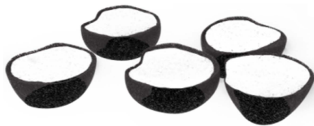
Figure 2. Salt container