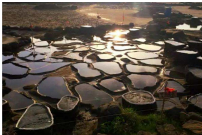
Figure 1. Volcanic rock salt drying tank

大小不一、无规则散落在滩涂上的火山石晒盐槽(如图1所示),形成了儋州古盐田遗址独特的海盐晒制景观。火山石晒盐槽是由火山岩石打造的碗式盐槽,直径从约0.5米到2米不等,是原生环境中最具代表性的场景画面。将盐槽形态通过调和毗邻轴比例、形状、色彩、材质、肌理等排列组合方式的修辞行为,设计为符合仪式化叙事语境要求的取盐容器(如图2所示)。