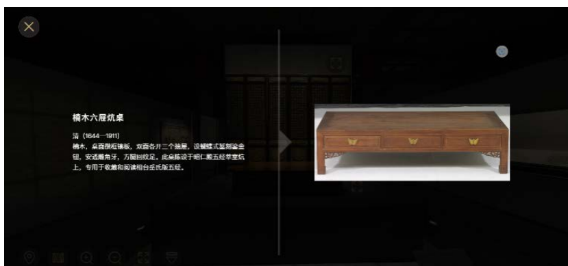
Figure 3. A 3D Nanmu Kang table with six drawers in the Palace Museum 图 3. 故宫博物院的 3D 楠木六屉炕桌