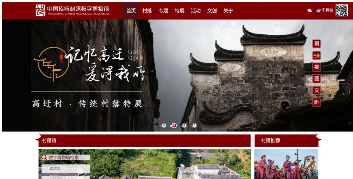
Figure 1. Traditional Chinese village Digital Museum 图 1. 中国传统村落数字博物馆