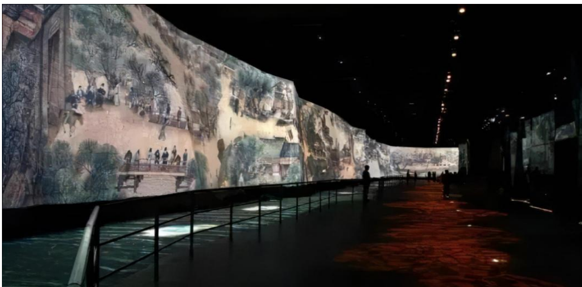
Figure 4. The China pavilion in Expo 2010, 4D of riverside Scene at Qingming festival 图 4. 世博会中国国家馆 4D《清明上河图》

多媒体交互展览是利用全息三维成像、多媒体 4D 影院、幻影成像[5]等技术将展品进行全方位的展示,立体仿真的展品让参观者可翻转欣赏、观察细节,甚至还赋予一定的娱乐功能,虚拟现实科技极大地丰富了展品被展现的时间和空间,以丰富的表现手段让“沉睡”的展品变得“活灵活现”,更加立体逼真,满足游客的好奇心,同时丰富游客的体验感受。在浙西地区乡村数字博物馆中运用这种方法,可以通过多媒体 4D 影院把乡村的历史风貌、生活场景重现于游客眼前,身临其境感受乡村变迁,动态的展示手法对年轻群体更有吸引力,而配有音频讲解功能还可以解决乡村当地居民文字阅读困难的问题。以世博会中国国家馆的《清明上河图》为例(如图 4),其它利用多媒体技术、三维动画技术、现代投影等现代高科技手段,让距今有 900 多年的《清明上河图》中的人物都“动”了起来,让每一个到访的来客在浏览过程中身临其境般体验明朝年间繁华的景象。