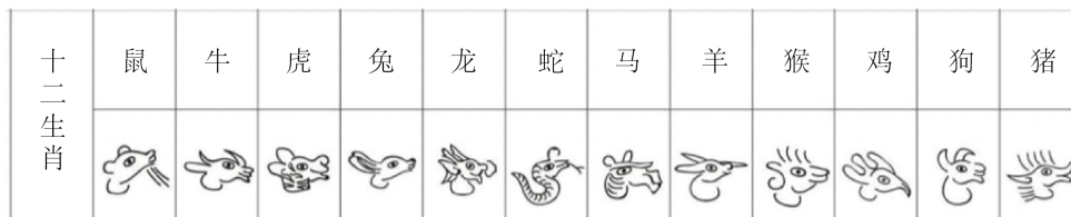
Figure 1. Naxi Dongba animal hieroglyphs 图 1. 纳西族东巴动物象形文字

第一步要做的是选取合适的参考对象进行观察并临摹。笔者选取了如图 1 所示的十二生肖象形文字作为基础参考。通过肉眼观察以及动手临摹，可以总结出大部分东巴动物象形文字的特点，即以侧面的形象和一只眼睛示人。除了“蛇”以全身形象其余的动物象形文字都截止于脖子位置，且大多数呈现“C”型的动势。