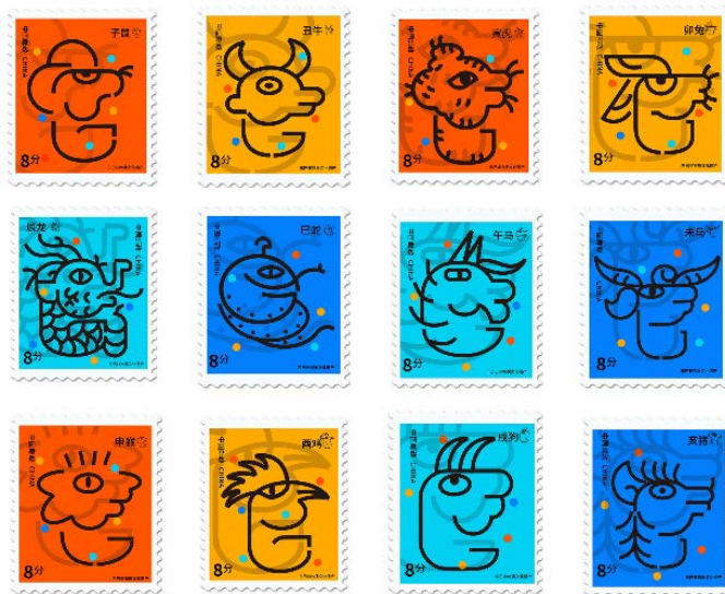
Figure 4. Design of Dongba animal hieroglyphic stamps 图4. 东巴动物象形文字邮票设计

如图4所示的邮票设计时,以图形化后的东巴文字为主体,放大并降低其透明度作为背景来增加画面的层次感,缩小并置于角落增加文字并使其充当画面中点的元素,邮票的主体色彩用优化过后的东巴画中常用的颜色,铺满画面作为背景,图形化过后的文字置于版面中仍然存在不平衡的感觉,故加入了彩色圆点的元素在色彩上平衡整个画面。由于主体采用线的表现形式,结合以上使得整个邮票设计中点线面分布均衡。