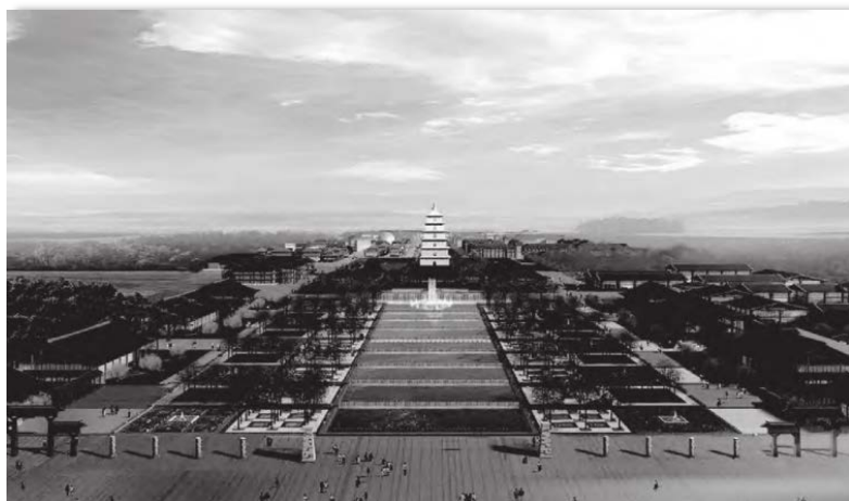
Figure 4. Effect of Dayan Pagoda Square 图4. 大雁塔广场效果 ④

大雁塔广场位于大雁塔北侧，围绕大雁塔而建，因此又被称为大雁塔文化广场。广场建筑面积约为11万 \text{m}^2 ，处于大雁塔的主轴线之内，东西宽度约为218m，南北长度约为364m，广场正中由水景喷泉、文化长廊、园林景观等进行组成，是目前中国最大的以“唐文化”为主题的文旅类广场，如图4所示。