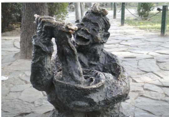
Figure 8. Sculpture sketch of noodle belt (Shaanxi Eight Monsters Series) 图 8. 面条像腰带雕塑小品(陕西八大怪系列) ®

艺术品, 不仅是可作为游客们的旅游纪念品, 在向中外游客展现了陕西传统文化的博大精深, 传达着黄土地上醇厚、古朴传神的民俗风情。