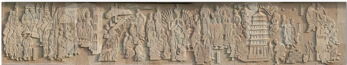
Figure 5. Relief in the Big Wild Goose Pagoda Square 图5. 大雁塔广场中的浮雕 ⑤

在整体布局上充分借鉴了唐朝“里坊”的布局设计形式，整体规划整齐有序，充分展现了唐朝建筑布局构建中的高度理性，具有浓厚的历史观感；在空间表现上，以大小、长宽高低错落的雕塑、平台等景观进行摆置，南北高差约为9米，广场细分9大平台，契合唐朝的礼仪制度；在细节设计上，无论是广场中的灯柱还是文化柱，其柱面图案通常选择与大雁塔佛教文化、唐代文化相关的图案内容作为主题，例如丝绸之路、千面佛像等以雕刻形式进行图案展现，这些细节又与大雁塔古迹进行文化呼应，进一步烘托了大雁塔古迹的历史氛围；在文化意境塑造上，大雁塔广场北墙集中了浮雕区，以“大唐盛世”作为其主题[9]，如图5所示，浮雕长约106米，将唐代佛教文化盛况、大唐盛世繁荣浓缩于浮雕设计之中，不但起到了弘扬唐代传统文化的目的，对于广场的南北分割起到了很好的分割作用；在广场地面设计上，采用“地雕”形式进行呈现，主要以传统花纹、唐代书法作为地景表现元素，例如浮雕中常见的花纹如宝相花、唐草纹、陵阳公样等，如图6所示，不仅花纹效果细腻高雅，展现了唐代文化的雍容典雅，还集中将唐文化美学融入在广场地面设计之中，增强了广场地面景观的文化内涵。透过大雁塔广场中的景观设计表达，集中展现了唐代传统文化中的开放性、丰富性、多样性、兼容并蓄特点。