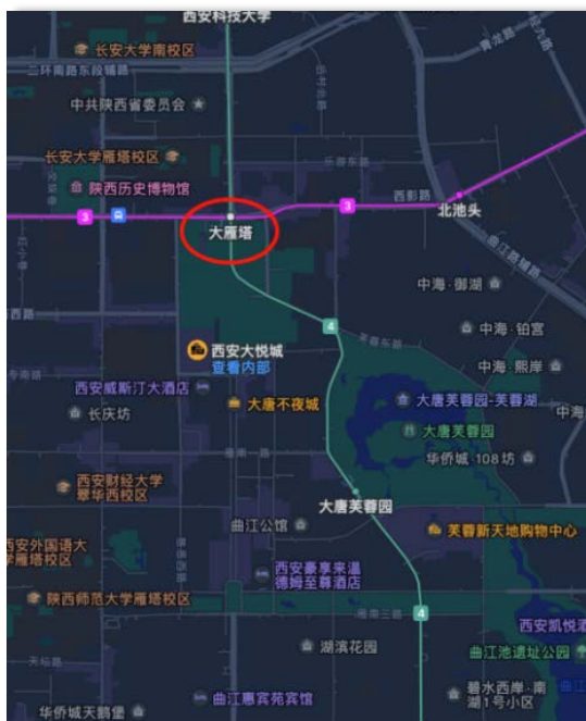
Figure 1. Location of the Dayan Pagoda scenic area 图 1. 大雁塔景区所在位置 ①

大雁塔景区位于西安曲江新区,以闻名中外的大雁塔和曲江皇家园林遗址为中心,是西安市城市中心区的重要组成部分,其区位如图 1 所示,四周遍布名胜古迹、主题公园和各类休闲文化场所,契合了西安文化古城,大雁塔景区位于曲江新区的核心位置,曲江自古就是西安著名的皇家园林,在盛唐时其景亦胜,曲江池四岸之旁,书中记载紫殿红楼,殿宇连绵,树木繁茂,更是长安士民踏青登高,寻幽觅胜之处,作为西安市著名的旅游景点,民间说法更是有“不来大雁塔,不算游西安”一说[7]。