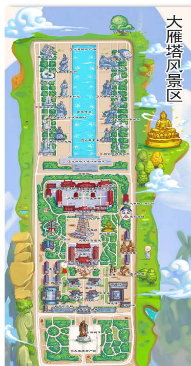
Figure 3. Layout of landscape planning of Big Wild Goose Pagoda scenic area 图 3. 大雁塔景区景观规划布局图 ③

从景区规划结构来细分,大雁塔是整个大雁塔景区景观设计的轴线焦点与中心,景观设计结构以东西轴线大唐通易坊与南北轴线大雁塔北广场、大唐不夜城进行相交,以景观序列形式进行呈现,三大主题公园分布在大雁塔四周,分别为唐慈恩寺遗址公园、陕西民俗大观园、陕西戏曲大观园,逐步形成了“一个中心、两条轴线、三个主题公园”的景区布局,具体景观规划分类如图 3 所示。