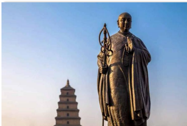
Figure 7. Sculpture of "Xuanzang Building a Pagoda" 图 7. “玄奘建塔”雕塑 ⑦

大雁塔景区中的 3 大主题式公园以传统皇家园林文化为整个园区布局原理，是整个景区景观中的重点附属文旅体验模块。唐慈恩寺遗址公园占地 3.6 万 m 2 ，园区设置在慈恩寺遗址的东侧，其前身是曲江出晓园，其主题特色鲜明，围绕大慈恩寺进行园区景观开发，其内部供奉了释迦摩尼的雕像，佛像身后是大慈恩寺遗址，园区内景观雕塑中以最具中外闻名的“玄奘建塔”被世人所熟知，具有鲜明的历史传承意义，如图 7 所示。整个公园中的景观小品融入了唐代传统文化，各类诗歌、书法、茶道、等元素分别以雕塑形式进行展现 [10] ，园区内部的灯箱、石栏之上都题有唐诗内容，集中展现了丰富多姿的唐代文化与中国传统文化元素。