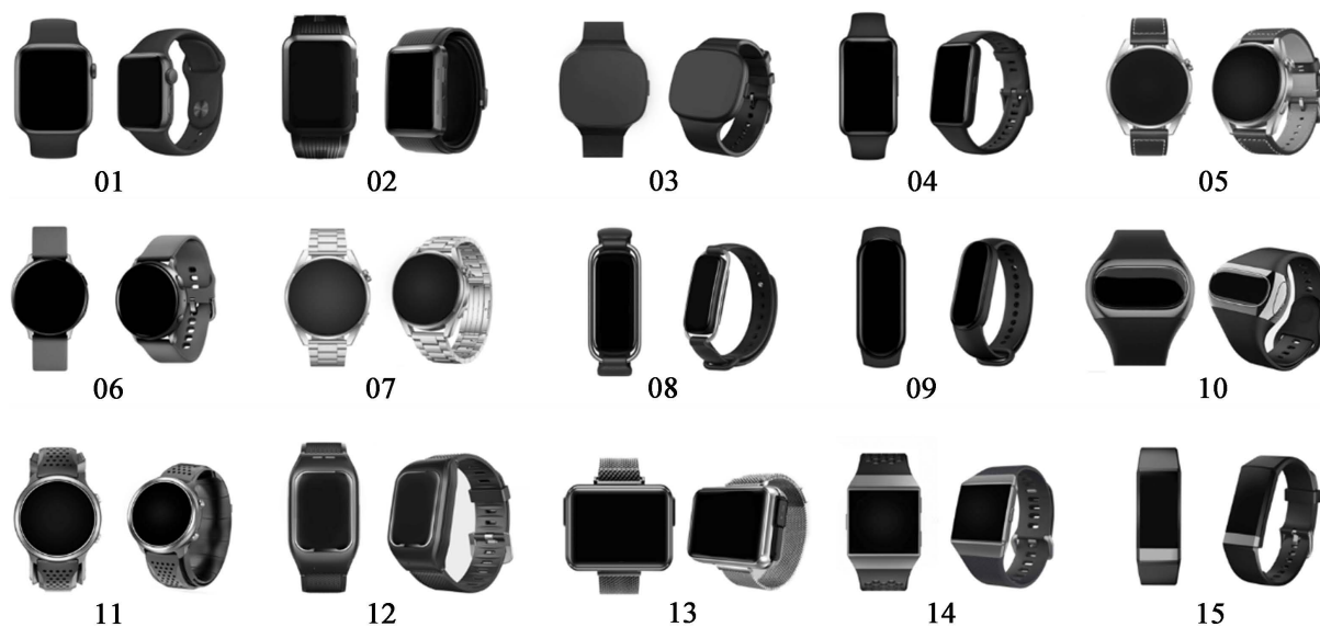
Figure 3. Sample stimulation plot after treatment