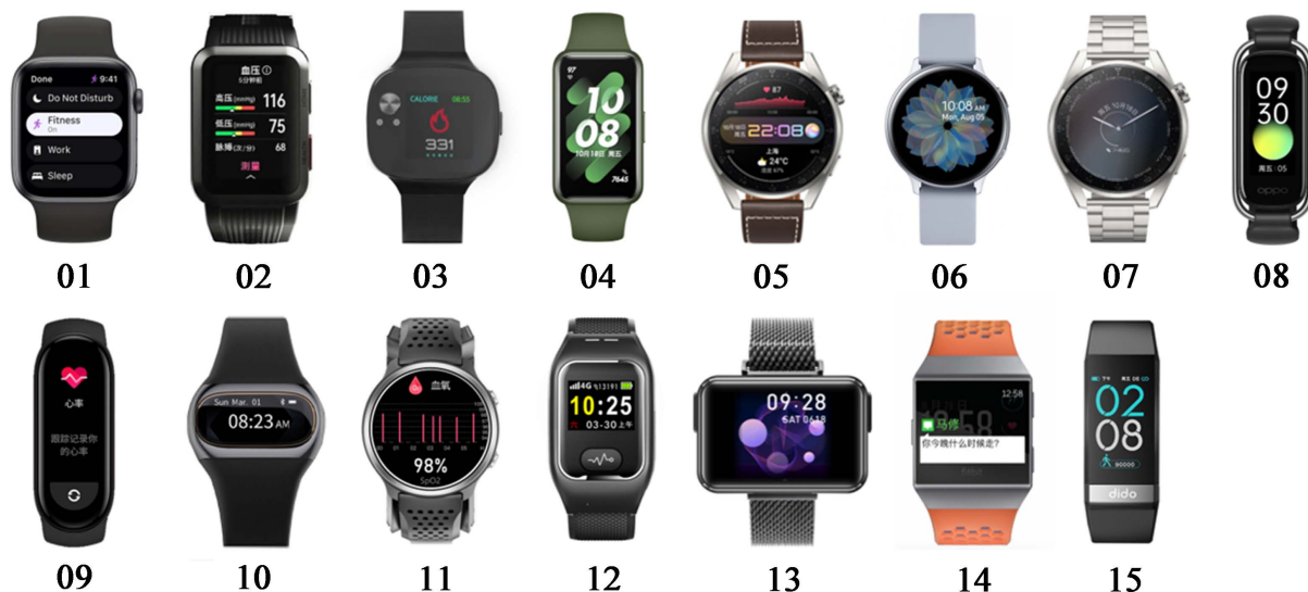
Figure 2. 15 Smart watch samples