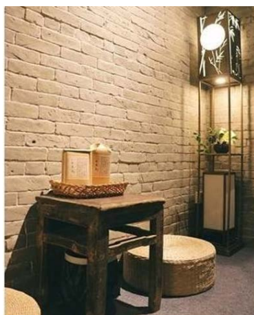
Figure 4. Interior decoration of Jihoutang homestay 图4. 积厚堂民宿室内装饰 ④