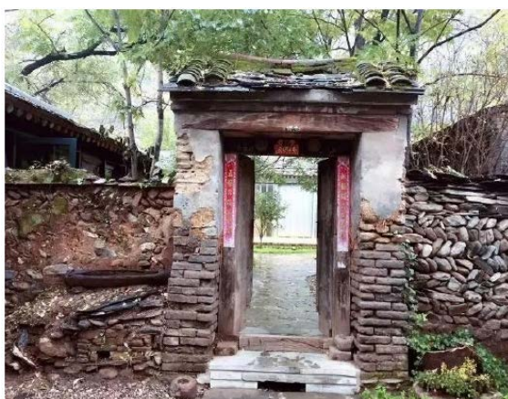
Figure 1. The gate of Beijing Grandma's homestay 图1. 北京姥姥家民宿的大门 ①

的故事。旧有建筑，有着新建筑所不具有的情感体验。另外，设计人员还可以对旧有建筑中被破坏的部分进行修补，对完好部分进行保护层的涂刷，加强旧有建筑的保护。当地的政府部门也要制定出保护政策，引导当地居民和过往旅客对旧有建筑进行保护[6]。例如北京的姥姥家民宿，这座民宿的原有主体，是一个住过五代人的晚清大院。该设计方案是在原有建筑的基础之上改造而成，并在很多地方都保留了原有建筑的原汁原味。走进这座民宿，最先引入眼帘的就是被得以保留的低矮院墙以及并不宽大的门楼(见图1)，但是正是这看似破旧不堪的建筑主体更能契合“姥姥家”的主题，和很多人形成了儿时的共鸣。在建筑装饰材料方面，墙体保留原有的石头材质和土墙，门楼的墙体保留原有砖块，门楼顶部的青瓦虽已经破旧，但是很好的营造出了整体的建筑氛围，塑造出很强的故事性。将原有建筑的保留更是将当地特有的文化特色展现出来，院内的客房也是沿用原有的建筑主体进行加固，基本上保留了原有的建筑样貌(见图2)，建筑主体中的青砖、石材、木质传统窗户、木质屋顶搭建和青瓦都是能够体现当地传统建筑特色的材料，处处能够感受到浓郁的当地文化。