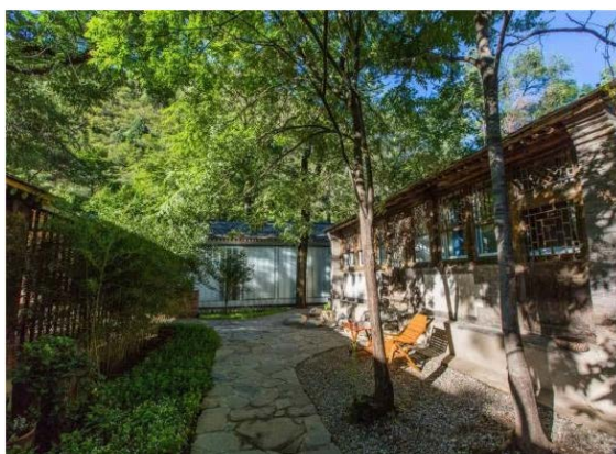
Figure 2. Room in Beijing Grandma's homestay 图2. 北京姥姥家民宿的客房 ②