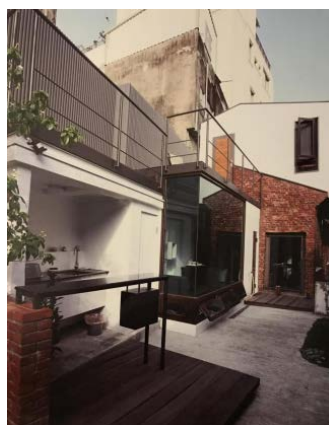
Figure 6. Chen Sang homestay 图6. 陈桑民宿 ®