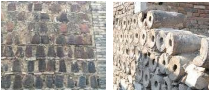
Figure 7. Building facade with saggar, kiln moraine, and yellow board 图 7. 采用匣钵、窑磳和黄板的建筑外立面 ⑦