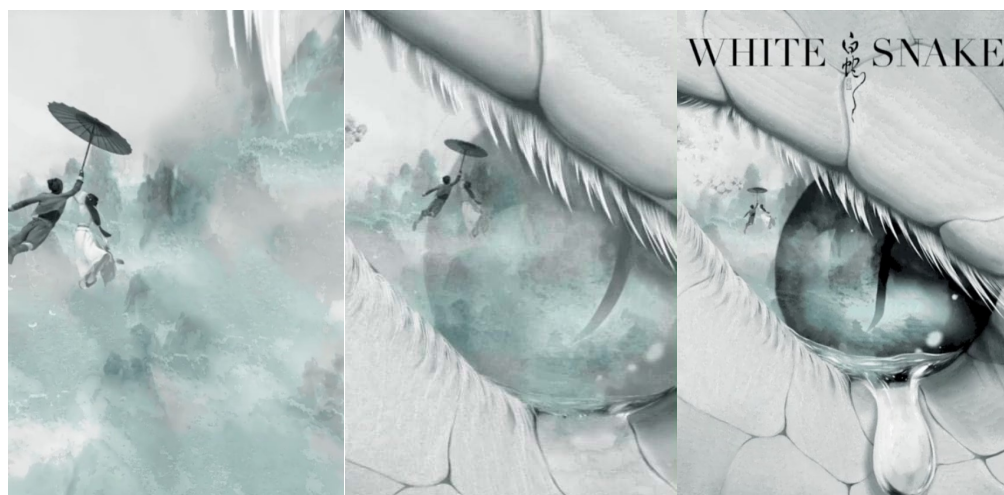
Figure 3. 《White Snake》poster 图 3. 《白蛇·缘起》海报 ③

叙事与生活是存在连续性的，通过这种连续性特征，可以增强受众在某些内容上的理解和体会。[4] 动态海报设计的叙事表现是具有逻辑性的情况下具有开端和结局，在过程中的变换根据时间轴推理来阐述。赵子谦在其研究中提出时间轴呈现出一个单位时间轴上的轴向发展，这个时间轴向的发展是叙事逻辑的推理，因此动态的连续是引导信息层叠传递给观众的重点。例如《白蛇·缘起》的电影海报(如图 3)中画面的起始由主角撑伞在空中飘荡的动效作为呈现信息的情境，远处的云中仙境和白蛇的眼睛叠化，视线的指引最终落入白蛇眼睛中。如果没有时间轴，那么画面的情境叙事将无法体现，叙事设计也会变成单一的元素叠加。将复杂的情节和深刻的寓意浓缩成视觉符号，强调内在元素的同时又形成了含蓄的设计美学韵味，让观众对电影产生兴趣和引发思考。