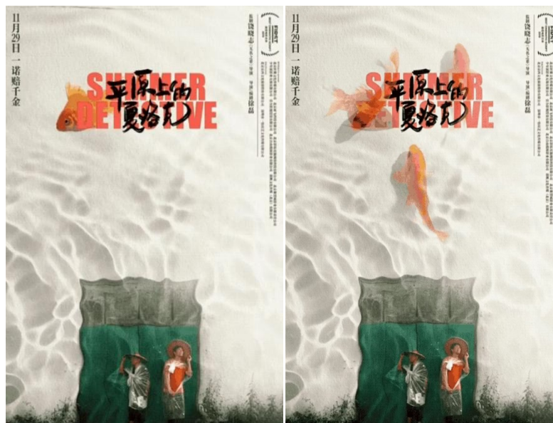
Figure 2. 《Summer Detective》poster 图 2. 《平原上的夏洛克》海报 ②