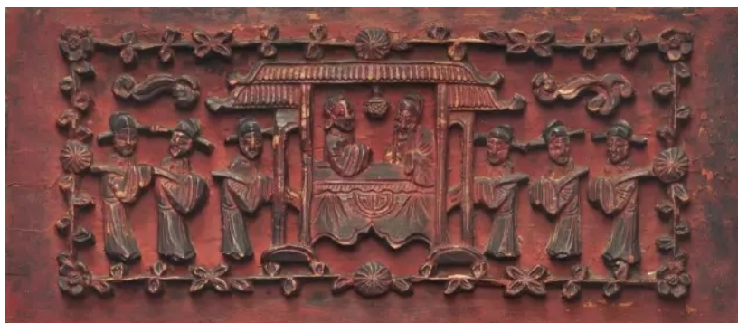
Figure 5. Guo Ziyi wishes birthday

人物塑造法。指在画面中刻画出特定的角色或人物形象，该方法可以通过对角色人物进行夸张、变形、装饰等处理，来突出人物的性格和情感。以作品《郭子仪祝寿》为例，该作品基于过去民间广为流传的传统故事，故事中的郭子仪是中唐时期的名将，地位德高望重，且子女众多，为世家大族。画面中的人物塑造就对应了前文所阐述的夸张与变形处理，放大整体的氛围(图 5)。