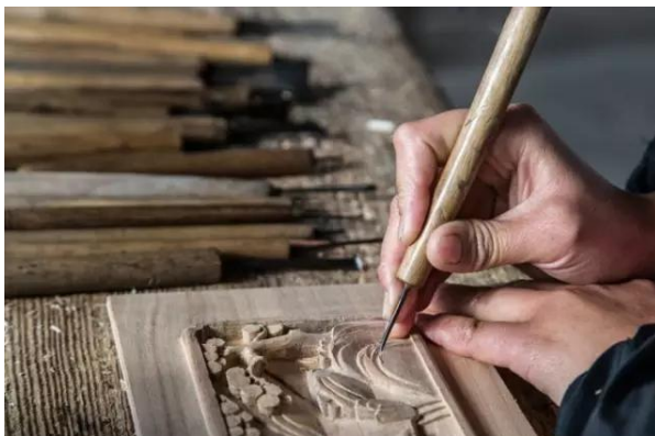
Figure 4. Carpenters are carving wood 图4. 木匠正在对木材进行雕刻 ④

光等多种后期处理技法,使得作品呈现出丰富的层次和细节。此外,徽州木雕还注重运用对比法则,通过雕刻和镶嵌等手法,使作品更加立体和生动(图4)。