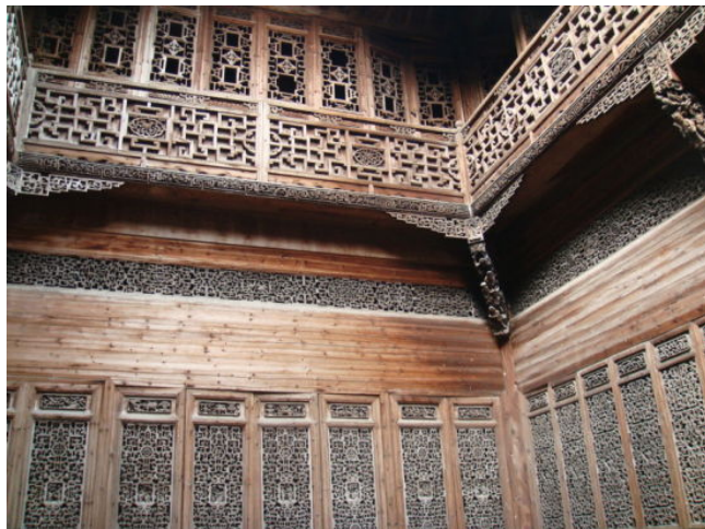
Figure 8. Wood carving of Zhichengtang in Lucun, Yixian County