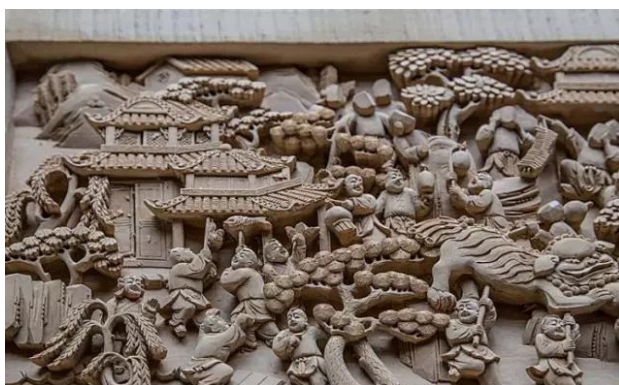
Figure 3. Huizhou wood carving 图3. 徽州木雕 ®

徽州木雕。徽州木雕是指在徽州地区生产的一种雕刻艺术，其主要表现形式是以传统木雕工艺制作而成的建筑构件，如门、窗、柱础等。这种类型的木雕通常会通过雕刻和镶嵌等工艺，将传统木雕艺术与现代建筑风格相结合，使其具有独特的艺术魅力和文化价值(图3)。