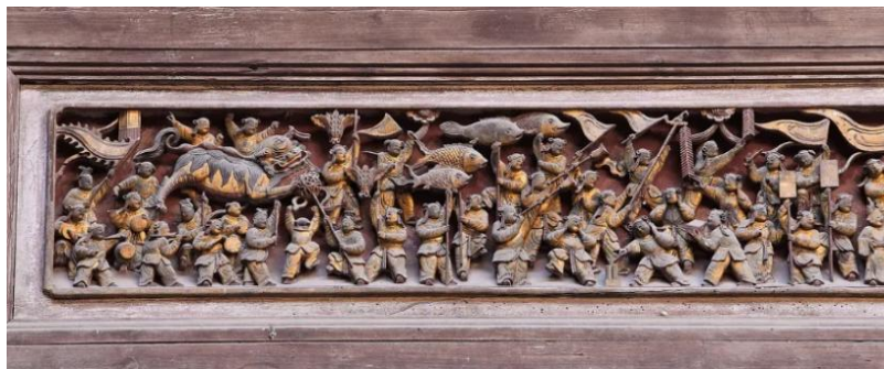
Figure 7. “Hundred Sons Lantern Festival” (partial) 图 7. “百子闹元宵” (局部) ⑦

徽州木雕人物造型通常具有优美的姿态和生动的神情动作，这些动作有日常生活中的场景，也具有一定的象征意义，如威严、慈悲、欢乐等，这些神态和表情往往通过面部表情、眼神和手势等细节来表现。以在宏村承志堂的木雕作品“百子闹元宵”为例，画面中的人物活泼，姿态富有张力，呈现出相当热闹的场景画面(图 7)。