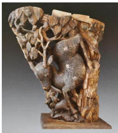
Figure 6. Wood carving Houlu arch 图 6. 木雕侯禄撑拱 ⑥

徽州木雕人物造型通常具有优美的姿态和生动的神情动作，这些动作有日常生活中的场景，也具有一定的象征意义，如威严、慈悲、欢乐等，这些神态和表情往往通过面部表情、眼神和手势等细节来表现。以在宏村承志堂的木雕作品“百子闹元宵”为例，画面中的人物活泼，姿态富有张力，呈现出相当热闹的场景画面(图 7)。