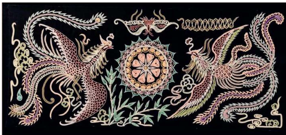
Figure 6. Horsetail embroidered phoenix pattern