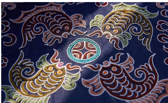
Figure 3. Horsetail embroidered fish pattern 图 3. 马尾绣鱼纹图案 ®

“在老家，吃鱼干，怀念故乡。”一首传统民间小调《水族》，把“鱼”作为一种神圣而又尊贵的存在，它代表了生命，也被视为一种传统文化，也被广泛应用于水族马尾绣服饰上，象征着他们对于家庭和谐、家庭团聚的信念，也象征着他们的家庭的和睦与幸运。主要出现在画面的主体位置或散布在中心的外围，一般组合出现。