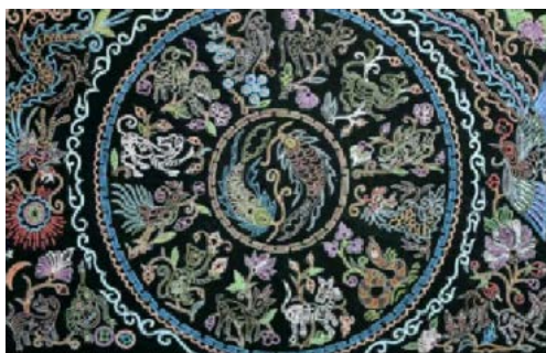
Figure 8. Horsetail embroidery asymmetrical pattern

除了有对称的构图方式外，其还有一种没有固定的构图形式，主要是将整个图案的轮廓限制在固定大小的空间内，使其呈现出某种特定的轮廓，常见的轮廓形状有方形、圆形、多边形等，在马尾绣中，如图8。