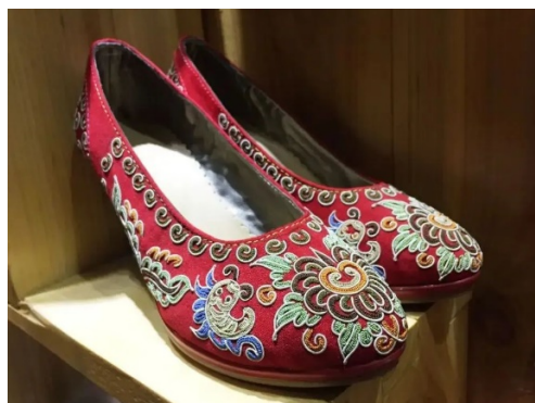
Figure 10. Aqua ponytail embroidered upper

水族马尾绣技艺并未在文献中体现，而是由水族妇女代代相传。因此，在构图上体现着便于记忆的特点。体现为在平面图上的刺绣构图很多基本是固定的，构图的模式化便易于记忆与传授。以鞋面为例，鞋前端三分之二为马尾绣花鸟纹样，鞋口周围及后跟便是编织针法的几何图形，如图 10。