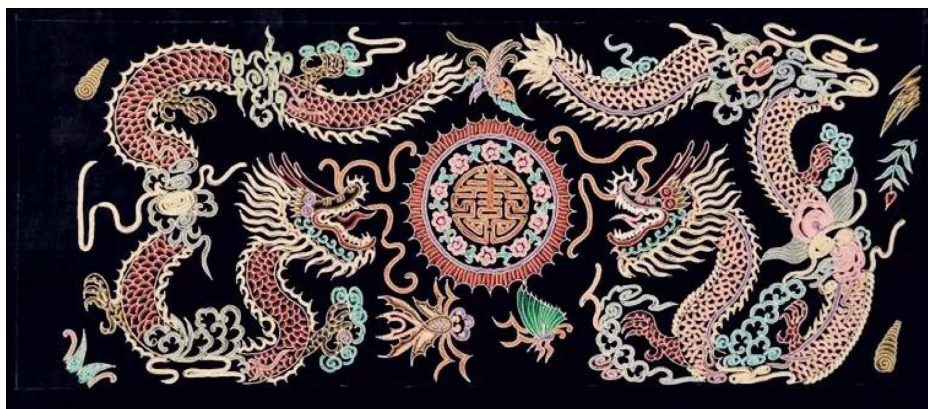
Figure 5. Horsetail embroidered dragon pattern