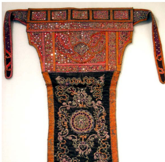
Figure 1. Aqua horsetail embroidered harness (now in the Shanghai Museum)