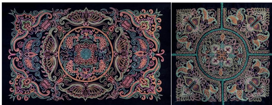
Figure 9. Horsetail embroidery symmetrical pattern

整体风格平衡而统一，但局部细节却富有变化。如图 9，它不仅展示了动态与静态的完美结合，更为整个画面增添了宁静而温馨的气息，呈现了中国传统文化中的对称美。