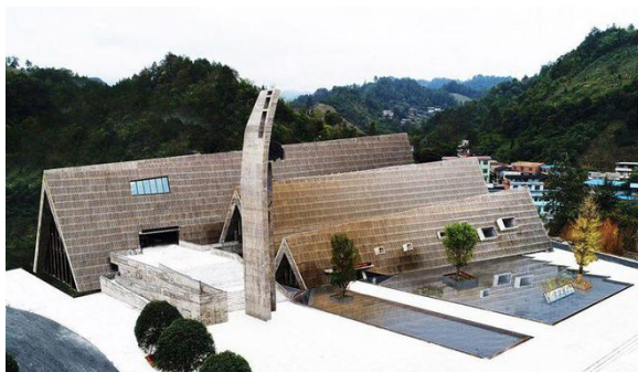
Figure 2. Sandu Aquarium Museum 图2. 三都水族博物馆 ®

关于地域性文化元素的典型性则是在文化多样性的背景下提出的。通俗来说，就是一个地方的地域性文化元素是多元的。比如贵州，黔中安顺地区既有汉族屯堡聚落，也有苗族的苗寨，而我们在提取的时候，就要选取典型且具有代表性的。如果做在安顺做一个地方文化博物馆，就要优先考虑提取屯堡的石头寨子文化元素。同样，如果在黔东南做地方文化博物馆，就需要选取苗寨的干阑式民居。在同一个地方，地域性文化元素是多样的，但是有文化也有强弱主次之分，强势的文化最后就变成了地区的典型文化。拿贵州省内来说，武陵山区侗文化、乌蒙山区彝文化。地方博物馆，是地方文化的集大成者，地域文化元素的提取当然要选择最具地方特色的文化。比如：魏浩波设计的三都水族博物馆(见图2)，中心的标志性造型是对水族语言的致敬，遵循了“山”这个字的形状。正面图案也受到水族的传统文字的影响，用到了呈三角形的“山”这个字，反复出现以形成“雨”字。