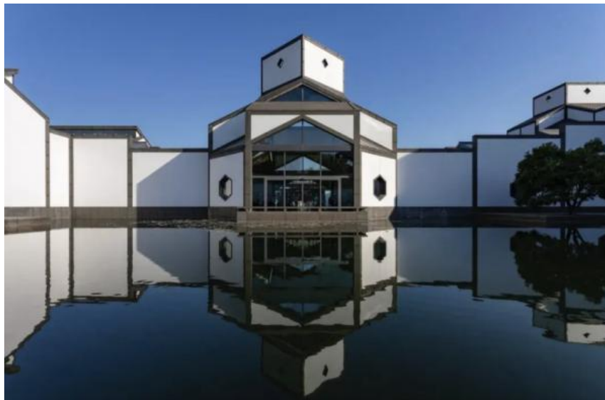
Figure 3. New Suzhou Museum 图 3. 苏州博物馆新馆®

综上，提取地域性文化元素时，要考虑到准确和适配两个大方向。在准确性研究时，重点在具体体现在提取地域文化元素要具有地方性和典型性。地域性文化元素选择准确后，还要放回场地，看该元素是否与环境相适应，切合场所精神。