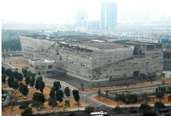
Figure 1. Ningbo Museum 图 1. 宁波博物馆 ①

例如：王澍设计的宁波博物馆(见图 1)，外立面提取宁波本土民居惯用的砖瓦作为地域性文化元素，就地将建筑拆除余留的砖瓦用与宁波博物馆的外墙，使宁波博物馆具有明显的地域性，他也因此作品成为首位获得普利兹克建筑奖的中国建筑师。在博物馆建馆过程中，也会发生地域文化元素提取不恰当的情况。