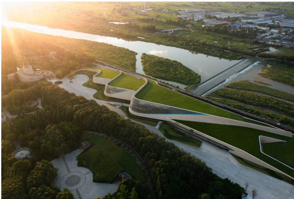
Figure 4. New Sanxingdui Museum 图 4. 三星堆博物馆新馆®

从以往的实际项目来看，博物馆建设的决策者已经具有了地域性文化元素用于博物馆建筑的意识，但是，许多还局限于具象运用。