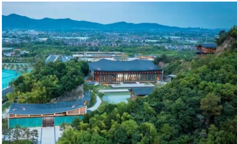
Figure 5. The core building of Hangzhou national version pavilion 图 5. 杭州国家版本馆核心建筑 ®