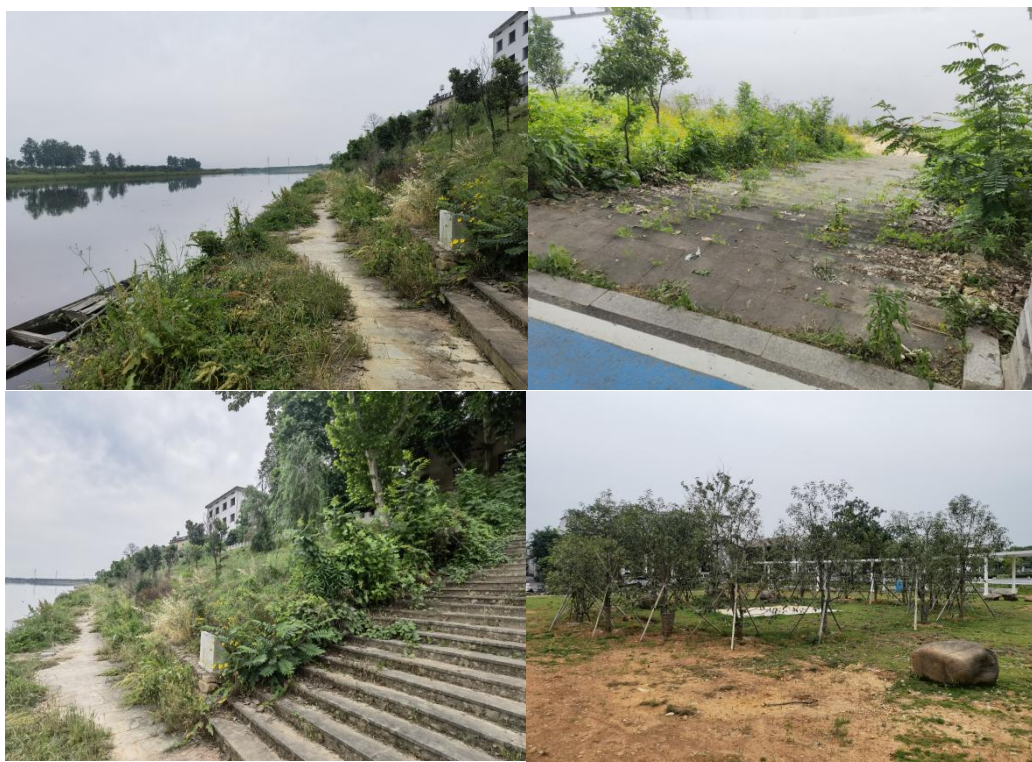
Figure 2. Current landscape status of Xinghuo Village Waterfront Space 图 2. 星火村滨水空间景观现状图

服务设施等都未带有鲜明的地域色彩, 缺乏当地特色文化的运用, 没有将村落滨水空间景观与星火村村落特色进行空间融合, 无法达到彰显浙江乡村文化特征和乡土特色的目的(见图 2)。