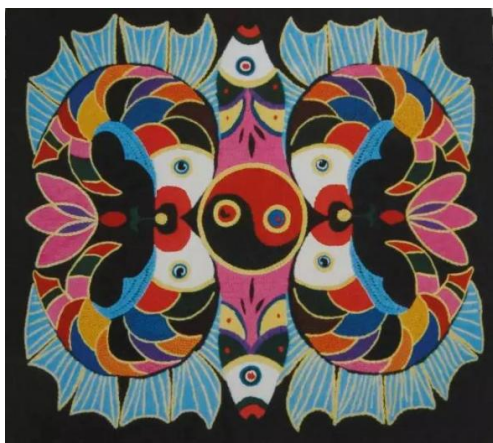
Figure 6. Fish pattern embroidery

苗族的先民曾生活在鱼米丰盛的洞庭湖一带，长期依水傍水促使他们在纹样题材选择上多采用水里的动物，以鱼纹、鸳鸯、龙为代表，鱼纹寓意着强盛繁殖力。图 6 为鱼纹绣品，黑色为底，绣线色彩丰富多样，构图上讲究对称协调统一，框架清晰，应用于枕套、床单、服饰等物品上。鱼纹绣品的图案立体感十足，将鱼的跃出水面的动作，活灵活现的展示在绣品中，充满了生命力。