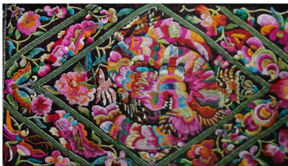
Figure 8. Miao embroidery pieces 图 8. 苗绣片 ⑧

画面布局饱满完整是苗绣的追求，对于一些大面积的色块，需要以填充绣法进行处理以丰富图案的层次感与质感，这与中国传统汉文化讲求大量留白的国画具有很大差异，具有典型的民间艺术特征。主要采用适形构图的方法，即在绣制之前，将设计好的图案用铅笔或者特制的水溶性笔在织物上画出线稿，以作为刺绣的参照。这种参照样式不一，形状各异，依据需要的服饰而定。在特定的范围内刺绣，以多种元素填充画面，使各部分均衡排列，既保留了一定的界定划分，又达到了饱满充实的画面效果。图案呈“限中有变、变中受限”之势，成为松桃苗绣最大的特点。如图 8 所示，整个苗绣作品被两个等比例菱形所分开，花和鸟的造型在框中适形饱满的排布着，然后以花朵、蝴蝶以及树叶等元素进行空白填充，使其更具圆润饱满之势。