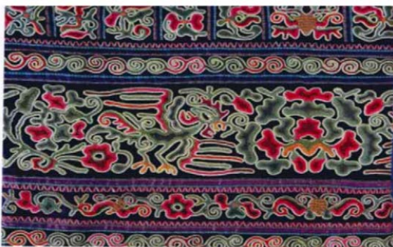
Figure 1. Regular geometric embroidery of Songtao Miao embroidery 图1. 松桃苗绣规则几何绣品 ①

几何纹样：松桃苗绣中几何纹样是最常见的纹样，是古老的构成形式。绣品中的每一针每一线都反映出苗族人民的迁徙文化。以图1和图2为例，图1是松桃苗绣弯曲且有规则的几何绣品，弯曲的线条如同山河的化身与动植物纹样巧妙结合，运用抽象的几何纹充当历史叙事的功能，借此突出纹样，形成富有装饰和文化价值的刺绣图案。