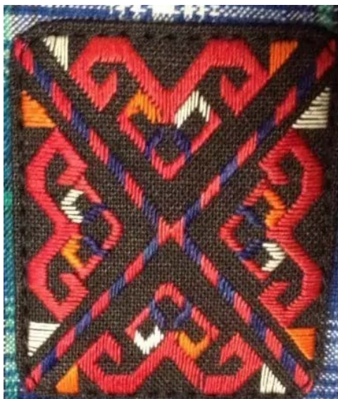
Figure 5. Symmetrical butterfly embroidery

图 5 为对称蝴蝶绣品，图案为对称的四个蝴蝶纹，也可成是四个对称的牛头纹。苗族有牛崇拜和蝴蝶崇拜，蝴蝶象征着生命的诞生，该绣品体现苗族农耕文化和祖先崇拜思想。