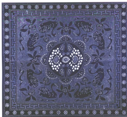
Figure 9. Miao embroidery quilt cover 图9. 苗绣被面 ®

苗绣这种图案连续重复的韵律感是一种理性的形式美，是手艺人日常生活中的理性思维的创造性活动。连续反复、均衡对称是苗绣遵循的形式法则，对称与均衡是苗绣的构图形式中最为普遍的样式，在绝大多数的苗绣成品中都能感受到对称美。同时苗族人民也于苗绣构图中努力追求节奏与韵律，在特定范围内进行同一纹饰元素的重复规整排列，展现了苗族独特的韵律之美。