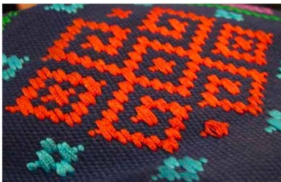
Figure 2. Circular embroidery 图2. 回字形绣品 ②

图2回字性的绣品，“回”字在苗族人民心中寓意着吉祥如意。其中，“回字”与周围的绣样相呼应，组成丰富的绣品，具有较强的装饰性。线条平整，呈现出独特的样式。以蓝布为底，搭配红、湖水绿两种绣线，色彩搭配和谐。介于抽象与不抽象之间，高度概括了回字形所蕴含的内容，且保留了民族特征。