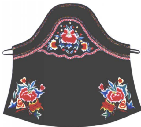
Figure 3. Miao embroidery apron 图3. 苗绣围裙 ®

蝴蝶在苗族人民心中占据着重要的地位，在苗族人民眼里，蝴蝶是美、幸福与自由的象征，也是生命的象征。超强的繁殖能力又是苗族人生殖崇拜的对象，是苗族神话里孕育了苗族始祖的“蝴蝶妈妈”，被苗族视为始祖之一。因此蝴蝶纹饰在苗绣里具有一定的代表性。如图3所示，苗族妇女常用的围裙，围裙前半部分用三个“几”字形的花纹封边，虽然中间图案没有出现蝴蝶的身影，单其形状似两只蝴蝶簇拥中间的石榴花，围裙下摆由两个左右对称图案所构成，色彩一如既往的丰富，仔细看，画面像蝴蝶支撑着石榴，巧妙的勾画蝴蝶舞动且曼妙的身姿，给人留下多重想象空间。