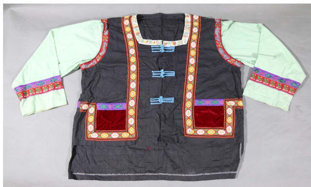
Figure 12. Gelao men's clothing 图 12. 仡佬族男士服饰 ②

葫芦、豌豆、竹子、牛蛇、牡丹、蝴蝶、鱼鸟、水、云取材于天空、大地、河流和森林，是具象的存在。而线条的勾勒、图形的组合、动物与花纹元素的拆分融合，又是抽象的艺术。在仡佬族服饰中，这些图纹广泛应用，充满想象力与创造力。如图 12，两袖为浅蓝色布，上身其余部分为深蓝色布，拼缝处采用几何纹样，领口处用红黄蓝绿四种颜色绣画纹样，口袋处为红色绒布，中间用九条蓝绳作扣，具体的花纹与抽象的几何条纹同时呈现，在整体布局上，形制对称和谐，颜色搭配充满美感。