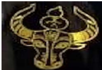
Figure 5. Gourd pattern 图 5. 葫芦纹 ®

图 5 中以黑布为底，金线绣牛头，头上顶着葫芦，图案较为可爱，牛和葫芦都是仡佬族人崇拜的图腾形象，刺绣立足于乡土，造型生动灵活，纹饰题材接地气，贴近民间生活，像外界表述和传达仡佬族的情感。