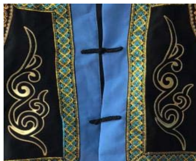
Figure 9. Cloud pattern 图9. 云纹 ®

有的以水波纹和回纹的图案样式对称出现在上衣衣襟左右两边和裤腿两边,如图9云纹和图10回纹。