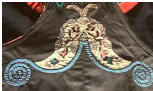
Figure 3. Butterfly pattern 图3. 蝴蝶纹 ®

而在苗族文化的影响下，新增了苗族刺绣的蝴蝶纹饰，苗族传说中蝴蝶妈妈诞下十二个蛋，孵化成苗族祖先姜央十二兄弟，而蝴蝶吃食植物时对花粉的传播，有利于物种的繁衍和生物多样性的平衡，被视作对自然的崇拜。图3 蝴蝶纹样式绣于仡佬族女式黑布上衣胸前，作为上衣的唯一动物图纹元素，对衣物的修饰点缀较为醒目，独具风格。