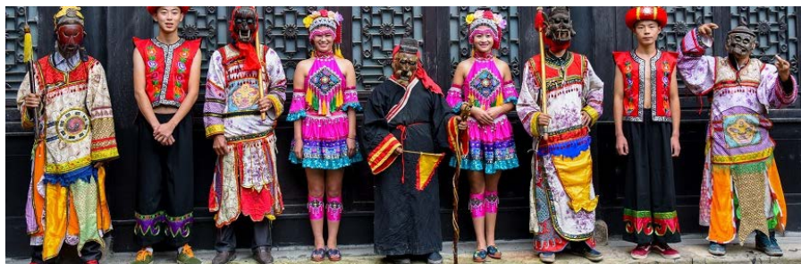
Figure 13. Gelaoyao nationality dress

生活在深山中的仡佬族，贴近自然，服饰上多喜黑青绿褐等色。随着民族迁徙、文化交融以及时代审美的变化需求，出现了粉色、黄色、白色、蓝色、红色等许多艳丽的颜色，夸张大胆的颜色，并不突兀，相反，通过图纹的点缀和修饰，看起来既和谐又美观。如图 13，是仡佬族人在舞蹈时穿的衣服，色彩、元素丰富，粉色、黄色、红色、紫色成为主色调，美观又时尚，洋溢着元气和活力。