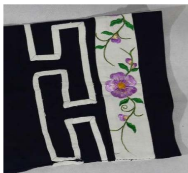
Figure 10. Hui pattern 图10. “回”纹 ®

图9中, 仡佬族人民对云有着无限的遐想与崇拜, 使云成为一种较为常见的符号。回字纹也因民间“富贵不回头”的说法被广泛使用, 用一笔勾勒出循环的线条, 寓意财富源源不断, 永无尽头, 另外还有“方回单体型、工字型、正反S型”[4]三种回字纹。