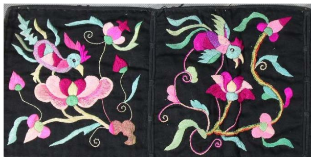
Figure 2. Bird pattern for Gelao nationality clothing 图2. 仡佬族服饰鸟纹 ②

仡佬族神话中阐述三叉鸟是西王母的传信神鸟，代表着幸福，有时鸟叫也被视作丰收的象征，因而鸟的图纹形象被广泛的运用于刺绣中，在服饰中较为普遍。图2 是黑底彩色平绣花鸟纹腰带，鸟纹与花纹的搭配，色彩鲜艳和谐，布局协调自然，这无不体现着务川仡佬族人民对美好生活的向往与追求。