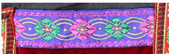
Figure 8. Diamond geometry 图 8. 菱形几何纹 ®

几何纹样：除动物纹样和植物纹样外，仡佬族人采用几何纹样修饰衣袖口、衣领面、衣侧叉、袖围、衣下拉，裤后袋、裤脚边、裤侧边，裙头、裙脚、裙腰，以及帽檐、鞋边等拼缝和边缘处，常见有菱形、三角形等简单的图纹，也有用几何图形勾画的日常生活场景纹样，还有菱形中穿插花纹、线条的组合搭配，如图 8 的菱形几何纹。款式设计丰富多样，与服饰整体协调融合。