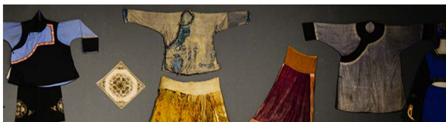
Figure 15. Gelaoyao nationality dress