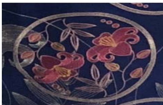
Figure 4. Bamboo pattern 图4. 竹纹 ®

图4 竹纹以竹叶和百合花的搭配出现，将创意融入到色彩、构图中，寓意多子多福，美好生活的开启，这种图纹的创新搭配充分展现了仡佬族刺绣的独特魅力，颇有生活情趣。