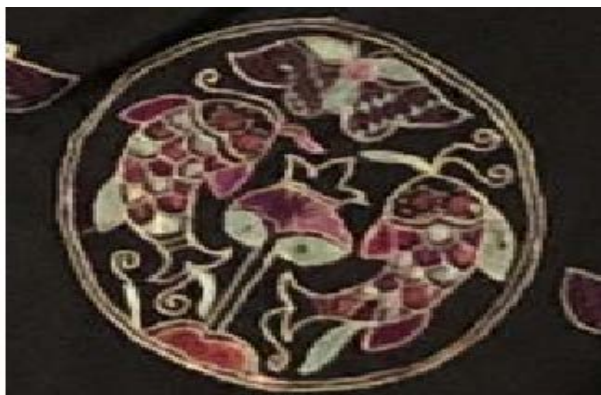
Figure 1. Fish pattern of Gelao nationality dress 图1. 仡佬族服饰鱼纹 ①

图1 刺绣以黑布为底，左右绣两条不同种类的鱼，中上方是蝴蝶纹，中间像是一朵绽放的花朵，给人留下想象的空间，元素丰富却不凌乱，勾勒出一幅鱼儿、蝴蝶、花朵和谐美好的景观图。