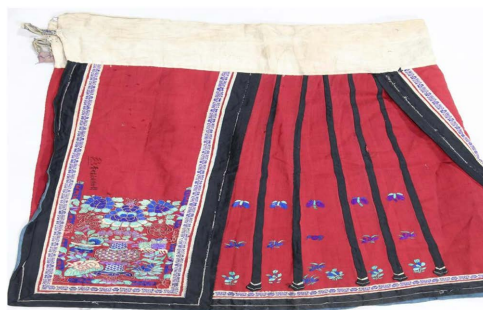
Figure 14. Plain embroidered peony apron

仡佬族人民对色彩的搭配有独特的审美，图 14 中围裙以红色布为底色，腰边用白色，黑条作修饰，点缀牡丹花纹、蝴蝶纹和鸟纹，几何条纹分布在左中右与黑边呼应将裙子分成几个部分，具有层次感和设计感。图 15 展陈在务川博物馆内，在色彩的搭配上极具特色与魅力，无不体现着仡佬族人民的审美情趣。