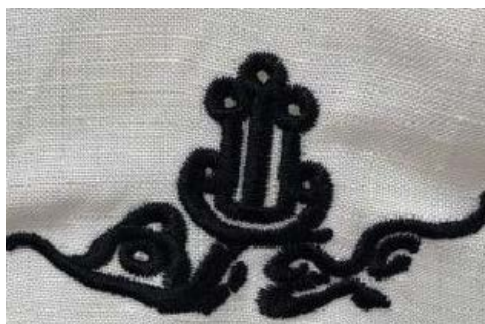
Figure 11. “He” pattern 图11. “合”字纹 ®

图11中合字纹不仔细看, 不太能发现是一个文字, 仡佬族人发挥想象, 将民族风格绣在衣裳上, 使物不仅仅是修饰之器, 更成为传承民族文化和民族自信的精神之道。