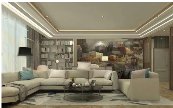
Figure 2. Nordic style home design 图 2. 北欧风格家居设计 ②

如在室内空间设计上，将木质家具作为装饰元素之一，从而使整个空间显得更加舒适和温馨。同时，在一些具有文化底蕴和风格的家居中，木材也是非常适合出现的。如一些中式风格和北欧风格家居设计中(如图 2)，木质家具作为主调部分出现也是非常合适的。