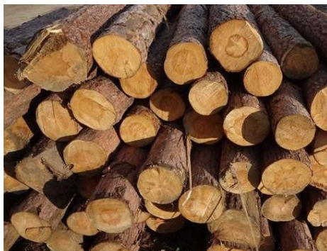
Figure 3. Red pine logs 图 3. 红松原木 ®

其中较为出色的是红松木，红松纹理自然(如图 3)，质地坚实，加工性能良好；木材颜色呈棕红色、黑色和红棕色等不同色泽，而且还具有非常明显的节疤和生长轮条纹，这种色彩的变化让人感觉自然而又和谐统一。在家具设计中常被应用于橱柜及柜门中作为装饰用材或者用于雕刻等工艺制作；也可用于制作桌椅、沙发等大件家具中；由于纹理美是红松在家具设计上的主要特色，所以将其作为硬木制作材料可以使家具的装饰性大大增强。此外，红松木材生长慢、数量稀少、寿命长等原因导致其木质纹理呈波浪状、象水纹一样具有动感和立体感。