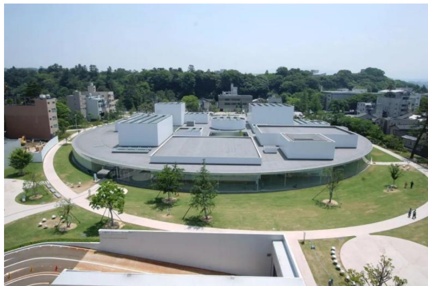
Figure 4. External space of 21st Century Art Museum in Kanazawa 图 4. 金泽 21 世纪美术馆外部空间 ®