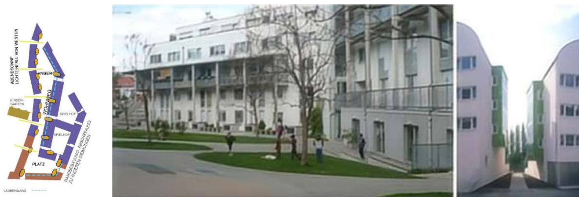
Figure 1. Women-Work-City

1991年,伊娃·凯尔(Eva Kail)和一群城市规划师在奥地利维也纳举办了名为《谁拥有公共空间——城市中的妇女日常生活》的摄影展览,展示了不同群体的女性在维也纳的生活状况,不久,维也纳便推出了一系列性别主流化的试点项目。所谓性别主流化(gender mainstreaming),即是在公共政策中纳入性别意识,目标是为每个人提供平等的城市资源[11]。