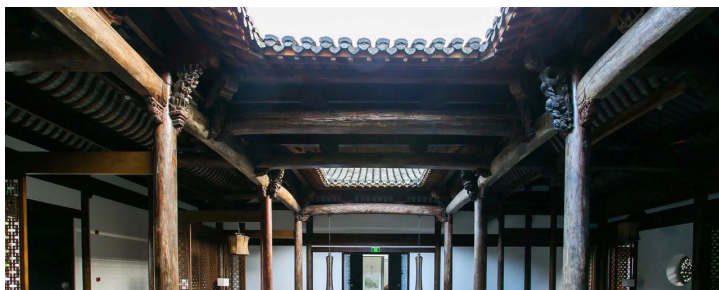
Figure 1. Lanting Anlu Lobby front desk

将木雕元素应用到酒店空间中,可以增强酒店的整体吸引力,提高客户满意度以及整个酒店空间环境的艺术品位。首先,徽州木雕元素可以与建筑周围的自然景观相融合,营造出更加和谐的氛围,缩短客人与空间的距离感。其次,徽州木雕可以反映当地的历史和传统文化,为客人提供有趣的教育性体验。最后,徽州木雕元素具有艺术性和装饰性,可以成为吸引客人眼球的焦点,精美的木雕元素可以增强酒店空间的视觉吸引力,吸引更多客人入住。在酒店空间中运用徽州木雕元素的案例是绍兴兰亭安麓酒店,并且被权威杂志评为“中国极美避世酒店”,为了达到让整个空间达到与外界联系的紧密性,在室内空间选材时大量采用木材,见图1。每栋建筑空间内都摆放着明清两代的徽派家具以及雕刻的珍贵古物,在建筑的结构上充分吸取木雕元素的艺术特征,例如:木雕牛腿、房门前的冬瓜梁等,经过了10年的时间进行雕刻完成,当人们进入酒店时,接受中国传统木雕文化的洗礼,让人们记忆犹新,从而也能提高空间的商业价值。