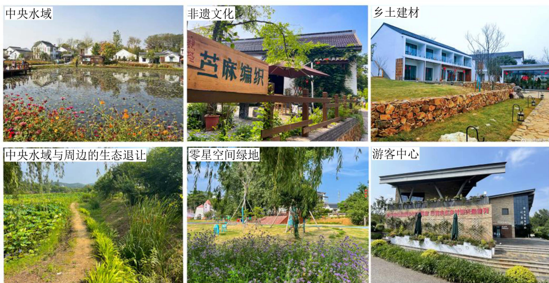
Figure 5. Construction status of Guanyin 图 5. 观音殿村建设现状