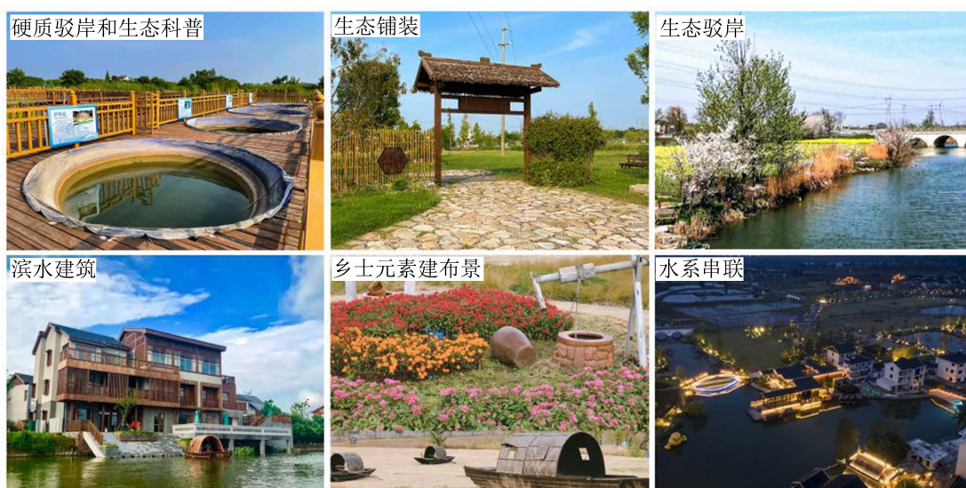
Figure 4. Construction status of Qianjiadu village 图 4. 钱家渡村建设现状

城郊融合类村庄与城镇关系紧密, 其生态振兴要考虑城乡在生态格局、产业发展之间的相互影响, 避免“城市化”过度侵蚀乡村原有肌理。钱家渡村的建设现状见图 4, 在结构布局方面, 首先应明确村庄与城市交接处的生态管控区域, 统筹修复被城市工业占据或污染的农田、湿地、水域等景观, 确保生态廊道连通度, 提高生态系统稳定性; 通过规划设计可将村庄内外生态空间与城市绿地系统布局连接起来, 发挥城市“后花园”的功能。产业发展主要是服务城市需求, 承接外溢的城市功能, 注重从单一农业转型为农业加旅游业。即在改良传统农业生产的基础上, 发展生态农业, 休闲农业, 观光农业等。并结合村庄区位、资源优势, 引入诸如互联网、会展等新兴产业, 实现城乡三产的深度融合与统筹发展。在人居环境提升方面, 在形式上要保留乡村原有形态, 依托自然山水或成规模的田园景观, 植入乡村空间美学, 与城市形成差异化; 在建筑、铺地及设施更新中, 要突破传统乡村建造体系的局限性, 对乡土材料和元素进行现代化转译, 留住乡愁同时适应现代生活方式。在节点设计上要尊重原有空间布局, 通过改造疏通, 串联起餐饮、民宿、村口、公社, 重塑传统乡村公共空间。