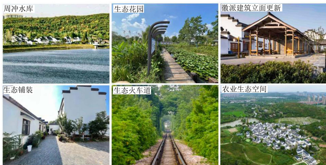
Figure 3. Construction status of Huashu village

集聚提升类村庄在村落结构布局方面,首要对各个村落内部要素进行梳理与评估,明晰土地、气候、村容村貌、公共设施、文化遗产等基础情况,确定中心村位置与周边村庄的地理联系,便于进行生态资源的统筹管理;判断是否有可发展为特色村的村庄,进而通过规划设计形成多核心、多功能的空间格局;对生态空间进行布局时,其载体可以是河湖池塘、山林湿地等面积较大、相对独立的生境资源,也包含生产空间中的防护林网、固土护坡等零散的生态敏感区域[6]。因而,应通过要素扩容来保证整体生态完整性和连通性;在道路规划上可围绕中心村设计环线并向周边村落延伸,确保每个村设有交通转换枢纽。产业发展上,要统筹各村的一、二、三产业,在中心村可构建科研合作平台,为生态农业提供创新技术并辐射至周边村庄;还可联合各村落特有产业,打造一村一品,形成田园综合体,发展乡村生态文化产业链[6]。人居环境提升上,应重点关注民居建筑、公共服务设施、游憩服务设施、铺装构筑等,并结合活动策划、视觉传达设计突出农事活动、民间技艺、民俗习惯、节庆活动等非物质性景观,桦墅村的建设现状见图3。