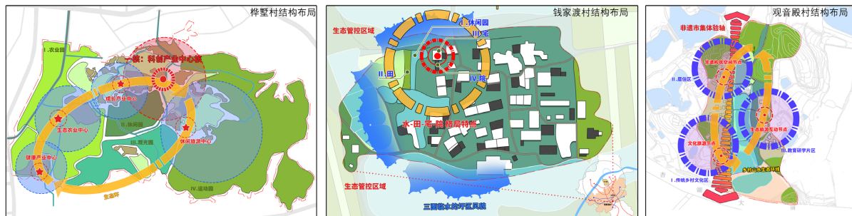
Figure 1. Structural layout of Huashu Village, Qianjiadu Village and Guanyindian Village 图 1. 桦墅村、钱家渡村、观音殿村结构布局