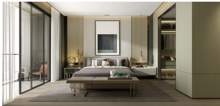
Figure 2. Application of fabric decoration in bedroom 图 2. 布艺装饰在卧室中的应用 ②

卧室是人们休息和放松的私密空间,布艺装饰在其中扮演关键角色。在选材上,柔软细腻的棉质或丝质面料可用于床上用品,透亮面料可增加窗帘的采光效果。同时,布艺装饰的摆放和布局需注意选用花色和图案增加层次感和装饰效果,例如,可以选择花朵、树叶等自然元素的图案来增添自然的氛围。此外,还可以通过搭配其他装饰元素来增强卧室的整体效果。例如,可以选择与布艺面料颜色相呼应或对比鲜明的家具、墙面装饰和灯具等,使整个卧室更加和谐统一。