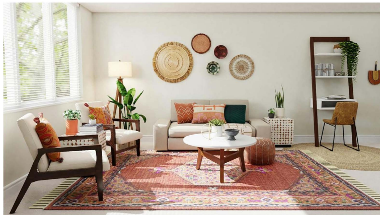
Figure 1. Application of fabric decoration in living room 图 1. 布艺装饰在客厅中的应用 ①

如图显示了整个客厅空间中贯穿使用的布艺装饰效果,包括地毯、沙发、座椅、靠枕以及墙面上的工艺品(图 1)。在这个装饰效果中,主要以地毯的暖色为基调,而相应的靠枕和家具也以相近的橙色调为主,搭配了米色、米黄等中性色家具,以平衡红色和橙色的活泼和鲜艳,使整体色彩更加柔和、自然,产生出和谐的视觉效果。此外,布艺材质以较为粗糙的麻面为主,与编织工艺品搭配,体现了空间的自然与温馨感。地毯和靠枕上的装饰元素多为几何图案与民族装饰纹样,展示了具有民族性的设计风格。由此可见,布艺装饰效果充分表现了对色彩、材质和图案的巧妙运用,为整个客厅空间注入了温暖、活泼和充满民族风情的氛围。这种装饰效果既符合现代家居的审美需求,又能够展现丰富的文化内涵,为家居空间增添了独特的个性和魅力。总之,布艺在客厅空间中的应用展现了其在室内装饰中不可或缺的重要性,不仅丰富了空间的视觉效果,更为人们的居住生活增添了美好与舒适。