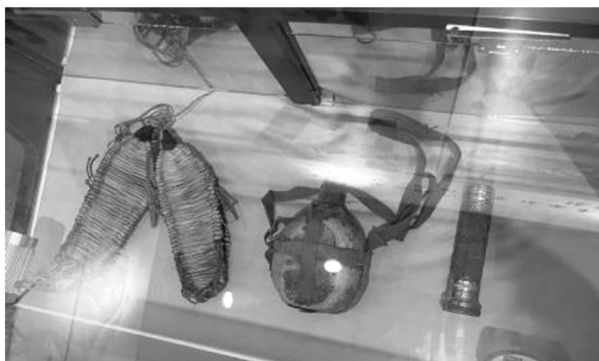
Figure 2. Remnants of Red Army in Zhu Village 图 2. 朱村红军遗留物品

朱村战役与“钢八连”：1944年1月24日(除夕)凌晨，日伪军1000余人扫荡山区及朱村。驻守在沭河东岸的八路军115师三营八连听到枪声后，火速奔向朱村投入保卫战斗中。战斗结束后，朱村人民慰问八连并赠送一面绣着“钢铁英雄连”的铭旗。1944年8月，在山东军区战斗英雄表彰大会上，八路军115师正式命名八连为“钢八连”(如图2)。