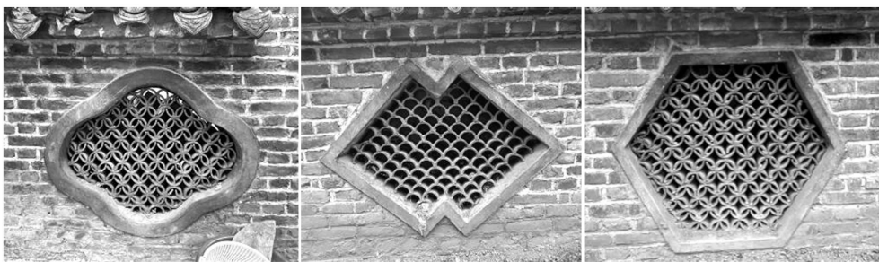
Figure 8. Zhu Village features flower windows and tiles dripping water 图 8. 朱村特色花窗及瓦当滴水

朱村的特色艺术构建中最具代表性的便是花窗设计。花窗多开在正门两侧围合的院落墙体上(如图 8)，建筑墙体高度约 1.5~1.7 米，花窗大小约为 0.7~0.9 米。花窗形式多样，其中海棠花窗，具有吉祥如意、繁华昌盛的寓意；两个菱形叠加的方胜纹样，一方面取胜的吉祥如意，寓意“优胜”，另一方面取其形的压角相叠，寓意“同心”；六角形花窗“六”和“禄”谐音，象征丰衣足食、家财万贯。花窗的设计代表了屋主人对生活的美好向往、同样还形成了“流动”景观，具有漏景、透景的效果。