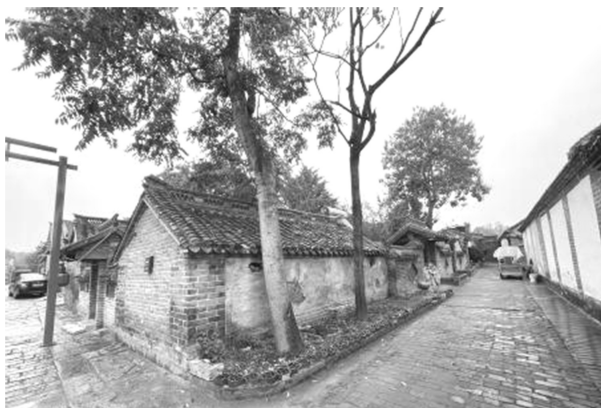
Figure 3. Zhu Village traditional courtyard 图3. 朱村传统院落

主屋也称为堂屋或正房,坐北朝南且多为3间,正房设置于北方,不仅体现“北为尊”的人伦思想,还具备寝室空间的私密性和隐蔽性。正房中间为厅,以作起居室或作为客厅,中厅空间往往摆放条几、椅凳,配有花瓶、镜子、钟表、字画等装饰,还隐喻象征家庭“一生平静、平平静静”等美好寓意。与其紧邻的两侧为套间,东西端两间独立开门,多作为儿女生活起居空间,俗称夹山房[2]。正门的朝向则是打破了传统四合院五行“巽风,进财”的东南角布局,更多是顺应街道划分(如图4),选择功能性更强的沿街开门,便于邻里交往、人流进出。