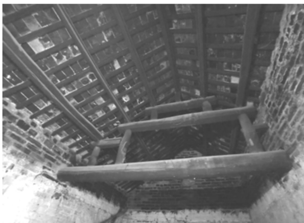
Figure 5. Zhu village residential roof 图 5. 朱村“彻上露明”屋顶

建筑墙体有 40 厘米厚，正房墙体外沿采用干插法的青砖堆砌，内部为夯土墙(如图 7)，是村落中最典型的墙体材质组合形式。墙体外部使用青砖材质，不仅具有支撑、加固建筑结构的作用，同时也避免因潮湿多雨环境造成墙体破坏。内部的夯土墙面均以当地黄土与麦草和泥夯筑而成，墙厚 30~40 厘米，墙头搁置圆木檩条，檩条间距 1.5 米左右，檩条上斜置竹竿作为椽子，竹竿间距 0.5 厘米，竹竿椽子上放置芦苇席，功能类似现代建筑坡屋顶上的油毡，再在芦苇席上滩涂泥灰并放置茅草，茅草材料一般采用水稻秸秆[3]。厚重的墙体及特殊的墙体材质组合，使得建筑具有冬暖夏凉，保温隔热能力强等优点。