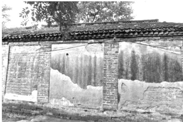
Figure 7. Zhu village house back wall material 图 7. 朱村正房背面墙体材质