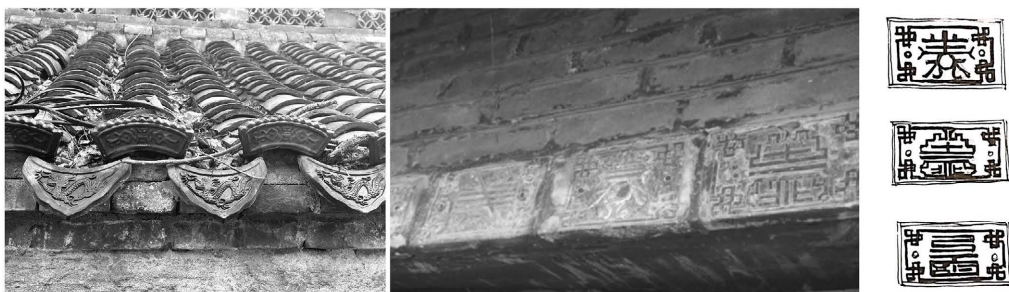
Figure 9. Zhu Village ancient building tile and brick carving patterns 图 9. 朱村古建筑瓦当及砖雕纹样

科学性、准确性和文物的真实性。就针对单体建筑保护要遵循两点设计原则，一是，建筑的原真性原则。尊重古建筑的原貌，尽量保留和保护历史遗留下来的原始状况和特色；二是，建筑的可逆性原则。修复工作应尽量做到可逆，即不破坏原有结构和材料，使修复后的工作能够被撤销，留有未来修复的余地。