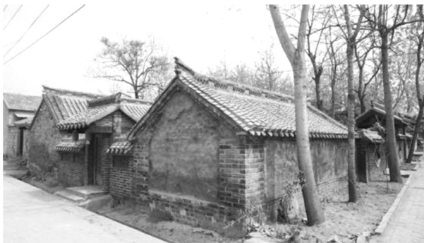
Figure 4. Zhu Village traditional courtyard gate location 图4. 朱村传统院落大门位置