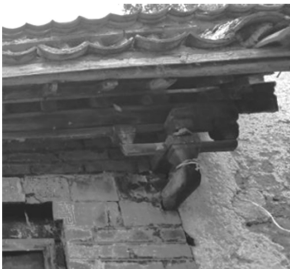
Figure 6. Dougong structure 图 6. 门檐斗拱结构