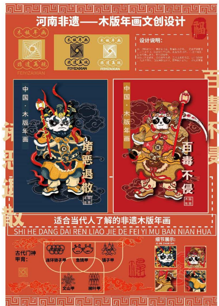
Figure 1. Zhuxian Town woodcut New Year illustration 图1. 朱仙镇木版年画插画

版年画一直以来的厚重, 色彩丰富, 色调鲜艳。主要有红色和深蓝色两种色调, 充满年味。而整幅插画的构图也比较饱满, 线条以粗线条为主, 为的就是突出中间的熊猫门神, 诸恶退散和百毒不侵的主题则是展示了前些年抗击疫情时国家的付出, 始终为了百姓, 站在抗击疫情的第一线, 使得我们老百姓真正的受益其中, 可以说整幅插画都紧紧围绕现代主题, 但是也并没有失去木版年画的特色与内涵, 创新性十足(如图1)。