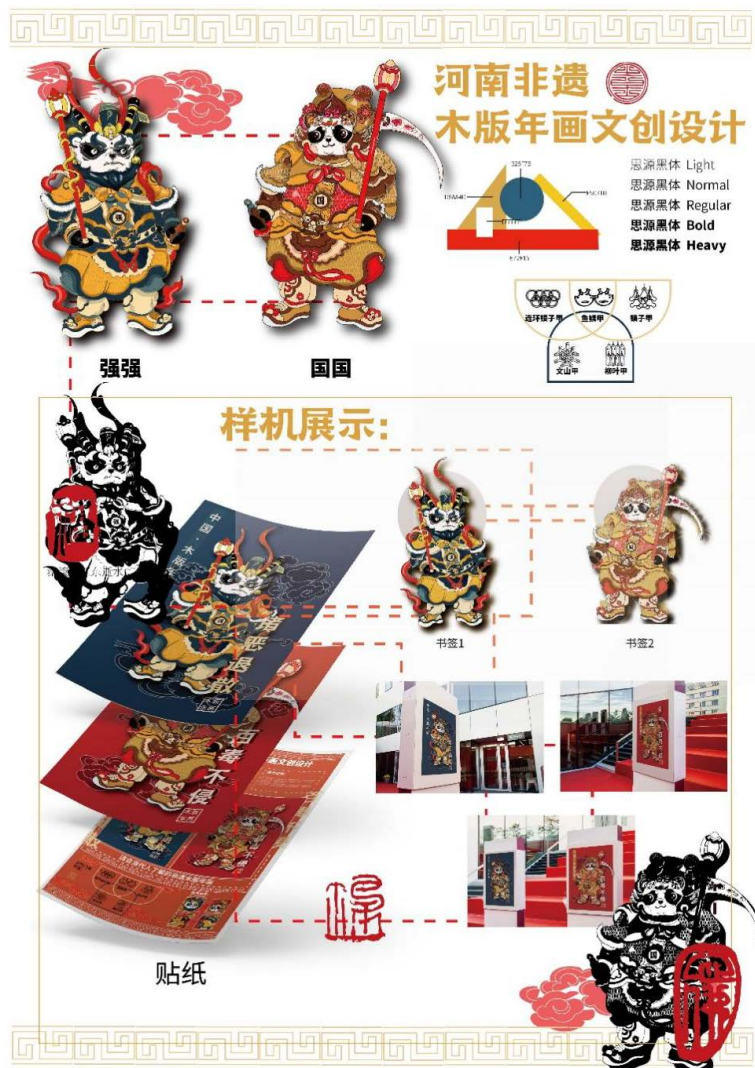
Figure 2. Cultural and creative design of woodcut New Year paintings 图2. 木版年画文创设计

文创产品不是生活用品就是工艺品,因为它可以直接被我们所使用。本课题将朱仙镇木版年画的形象印在了海报以及贴纸上,因为海报和贴纸都是日常生活中很常见的物品,并且还将年画形象做成书签和立牌,这些都突破了年画的传统载体形式,以此达到创新的目的(如图2)。在载体上进行创新的同时,网络时代,我们也可以增加线上的交互,如今 ui 设计盛行,我们也可以考虑是否可以给朱仙镇木版年画或者非遗做专门的针对性网站或者 APP,并在网站里做详细介绍和分类,这样子的话可以更加直接地去了解他们。文创设计注重的是内涵和生命力,让观众感觉到有趣,观众才会更想去了解这个作品本身。换句话说,无论如何,设计以及非物质文化是需要靠人们去传播的,他不能一成不变,而是需要随时代发展,这样子才能生存。