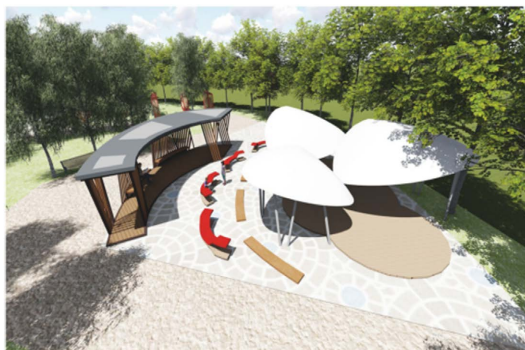
Figure 2. Outdoor theater 图 2. 户外剧场

给前来悼念的游客一个安静的场所来抒发自己的情感。纪念，是人们对于人或物的一种深层留恋怀念的情感。这座纪念性建筑作为沉思空间，为人类提供了一个缅怀与纪念的场所，同时也是文化传承的重要形式之一。在这个庄重肃穆的氛围中，我们追忆着逝者的历史，并从他们的历史中反思，如何走向一个更加幸福、更少伤痛的未来(图 3)。