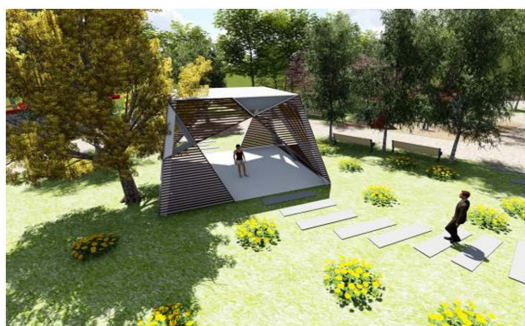
Figure 3. Meditation space 图 3. 沉思空间

给前来悼念的游客一个安静的场所来抒发自己的情感。纪念，是人们对于人或物的一种深层留恋怀念的情感。这座纪念性建筑作为沉思空间，为人类提供了一个缅怀与纪念的场所，同时也是文化传承的重要形式之一。在这个庄重肃穆的氛围中，我们追忆着逝者的历史，并从他们的历史中反思，如何走向一个更加幸福、更少伤痛的未来(图 3)。