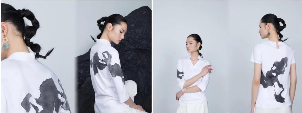
Figure 12. HEMU 2022SS “Give Shadow” series 图 12. HEMU 2022SS “绘影”系列 ①

在 HEMU 2022SS “绘影”系列(图 12)中,以泰祥洲老师的作品《观者大道》为灵感来源,将太湖石的形象以泼墨手绘的形式呈现在服装上,大量的留白面积和浓烈的泼墨手法结合体现了中式留白之美,表现出禅意之道,以抽象的水墨艺术表现形式渲染出观者独立的思考空间和无尽的遐想。