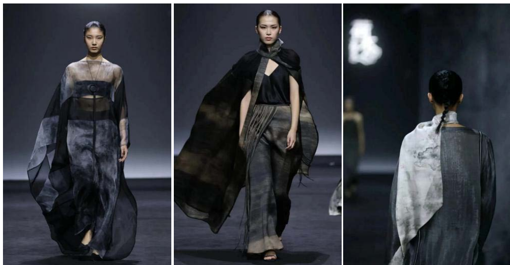
Figure 11. HEMU 2022SS series 图 11. HEMU 2022SS 系列 ①

荷木 HEMU 2022SS 系列(图 11)中运用云锦、缂丝、苏绣、苧绸等中国非遗的纺织染整工艺与泰祥洲老师的水墨面料作品相融合，呈现出别具一格的魅力。本系列采用桑蚕丝斜纹绸和绡两种材质，光泽感和轻盈度并存，营造一种虚实相间的感觉。在服装上使用不同质感的面料搭配简约大方的设计营造山水画中洒脱随性的神韵之美。