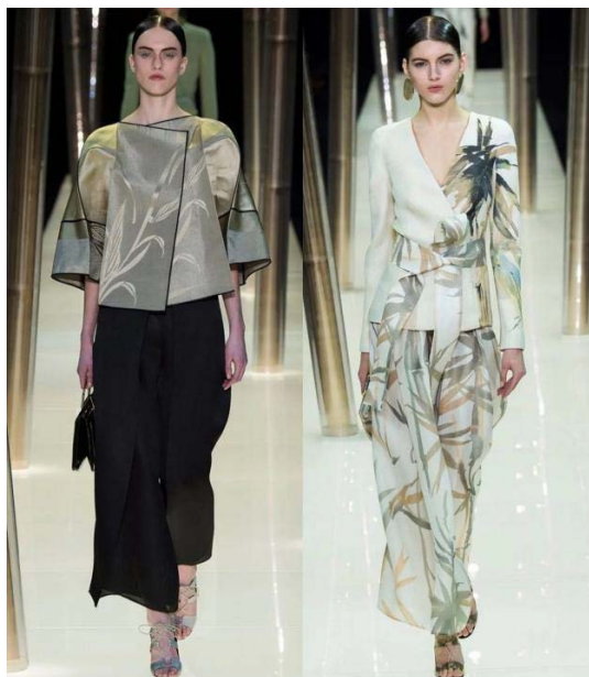
Figure 14. Armani Prive2015ss 图 14. Armani Prive2015ss ①

是精准透彻的，用水墨画的形式展现出淡雅、不失风骨的竹叶、竹枝，将水墨画里的文人风骨表现得淋漓尽致。