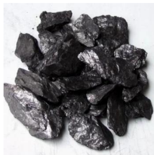
Figure 6. Graphite