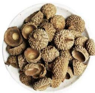
Figure 8. Acorn bowl 图 8. 橡碗子 ②