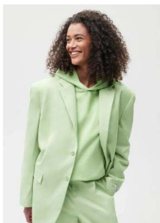
Figure 1. Pangaia brand clothing

图 1 是 Pangaia 品牌的服装, Pangaia 是一个集结科学家、工程师、艺术家和设计师的大团体,致力于推动更负责任更环保的运动。Pangaia 的单品都是由回收的材料和塑料制成,从植物、水果、蔬菜中提取的天然植物染料染色,从椰子灰、石灰色、黑色等中性色调到阳光黄、清新绿、番石榴粉等众多丰富色调,它的 T 恤采用天然海藻纤维制成,相比于棉纤维来说更加轻盈,吸湿效果更好,同时可以生物降解,此外, Pangaia 采用 TIPA 包装,是一种基于生物材料的塑料替代品,24 周内可以完全降解,标签和 logo 印花也都使用水性无 pvc 油墨。