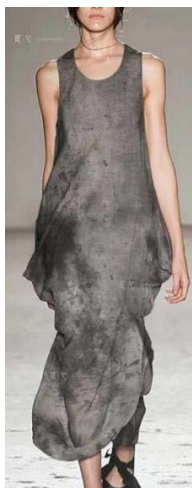
Figure 17. Black-gray clothing tie-dye