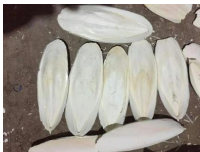
Figure 7. Cuttlebone 图 7. 乌贼骨 ②