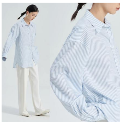
Figure 2. Marllen brand clothing