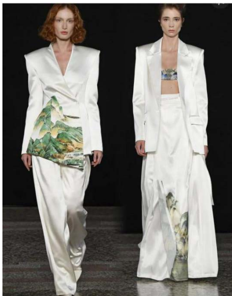
Figure 13. Loora PWD2024ss 图 13. Loora PWD2024ss ①

Loora PWD 在 2024ss 的秀场中(图 13)采用山水画的手法表现米兰的山景,服装上的印花清晰地勾勒出连绵起伏的山丘和海景,以山的不同形态为置景,表现出平静沉稳的意味。这种风景山水画的表现手法是以水墨技法为基础,采用印花的方式制作出具有中式水墨淡雅意境的图案,与西式剪裁的服装融合,东西合并,兼具时尚性与艺术感。