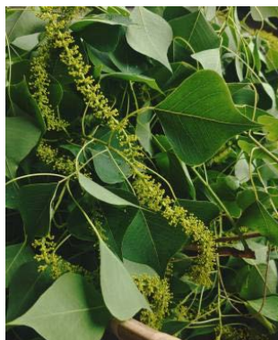
Figure 9. Chinese tallow leaves 图 9. 乌桕叶 ②