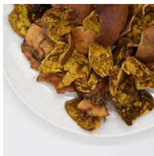
Figure 10. Pomegranate peel 图 10. 石榴皮 ②