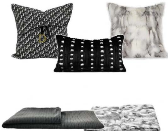
Figure 19. Black and grey furniture

黑灰色天然染料在家居领域的应用主要是用于布艺制品的染色，如窗帘、沙发套等(图 19)。黑灰色天然染料可以制作出色泽自然、柔和的灰色调，不仅可以增加家居的美观度和时尚度，还可以起到一定的保健作用。