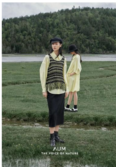
Figure 4. “AUM” brand clothing 图 4. “AUM 噢姆” 品牌服装 ①