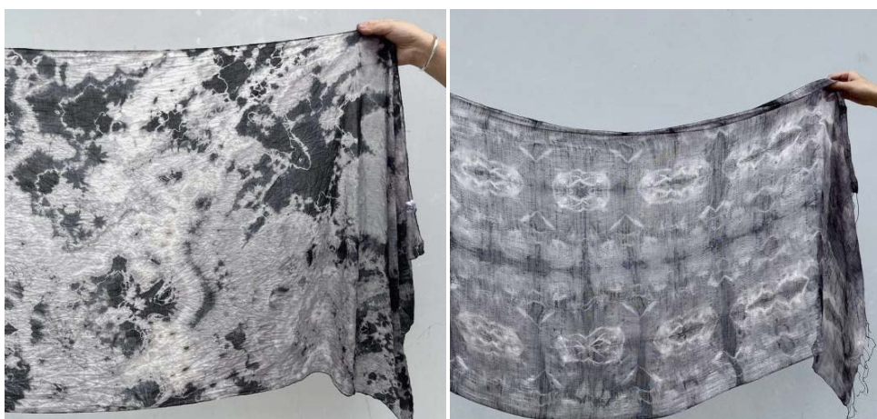
Figure 18. Gallnut dyeing effect

黑灰色天然染料在纺织领域的应用主要是用于天然纤维的染色，如棉、麻、丝等(图 18)。黑灰色天然染料可以制作出色泽自然、柔和的灰色调，不易褪色，特征鲜明，同时还具有一定的药用价值，可以起到抗菌、消炎等作用[4]。