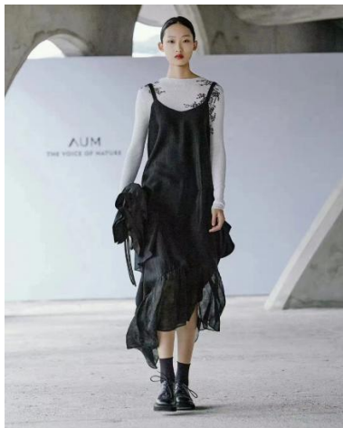
Figure 16. AUM 2022AW series

作为本土设计师品牌——AUM 噢姆，在 22AW 系列(图 16)采用天然的棉、麻、丝、毛为材质，注重版型剪裁，将抽象化竹子造型体现在服装上，演绎出写意水墨风格的服装，在简约的黑白配色中体现特有的东方韵味。