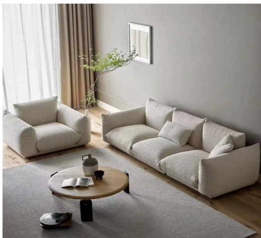
Figure 2. The milky white sofa makes people feel relaxed and lazy

女性的心理需求通常比男性更为复杂。她们更渴望得到情感上的支持和安全感。在家居设计中,沙发作为主要的生活空间和休息场所,其色彩设计应能够满足女性的这种心理需求。例如,温暖的色彩如橙色、黄色等能够带给女性一种温馨和舒适的感觉,而淡雅的色调如米色、乳白色等则能够带给她们一种轻松和宁静的氛围[5] (图 2)。女性的情绪倾向通常比男性更为丰富和多变。不同的色彩能够引发女性不同的情绪反应。例如,柔和的粉色、紫色等能够带给女性一种浪漫和梦幻的感觉,而明亮的红色、橙色等则能够带给她们一种热情和活力的氛围。因此,沙发色彩设计应考虑到女性的情绪倾向,让她们能够在沙发上得到情感上的满足。