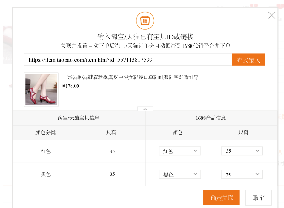
Figure 3. A solution to the problem of the “Pass Taobao” goods not on shelves