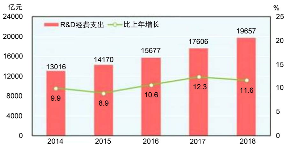
Figure 1. 2014 to 2018 research and experimental development (R&D) spending 图 1. 2014~2018 年研究与试验发展(R&D)经费支出

使用、完善科研项目事前、事中及事后有效监督、高校科研创新等手段架构高校科研经费财务精细精准标准化服务管理的思路。从面上真正意义上“放管服”，既不违反财务制度，又使科研经费达到高效、透明、准确，赋予科研人员科技创新的自主权和科研经费支配权，营造良好的科技创新环境和氛围，开创大众创业，万众创新的良好局面[6] [7] [8]。