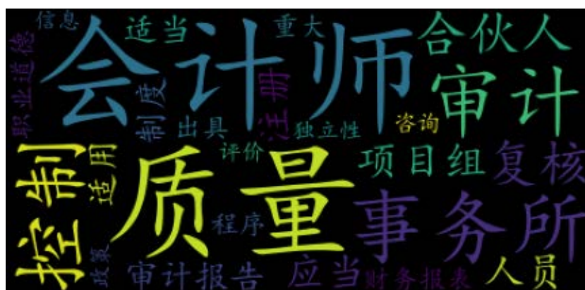
Figure 5. Word cloud statistics on the old 1121 standard