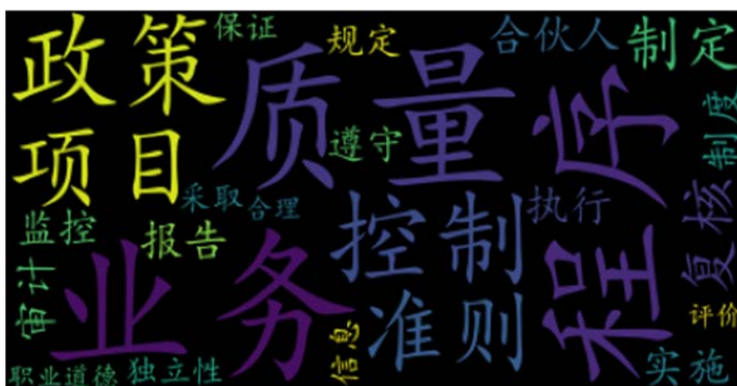
Figure 1. Word cloud statistics on the new 5101 standard

利用 python 工具结合库函数对新旧 5101 号准则进行文本挖掘,获得词频如表 1,词云如图 1、图 2。