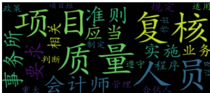
Figure 3. Word cloud statistics on the 5102 standard 图 3. 第 5102 号准则词云统计