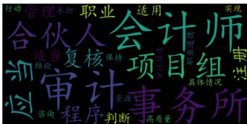
Figure 4. Word cloud statistics on the new 1121 standard