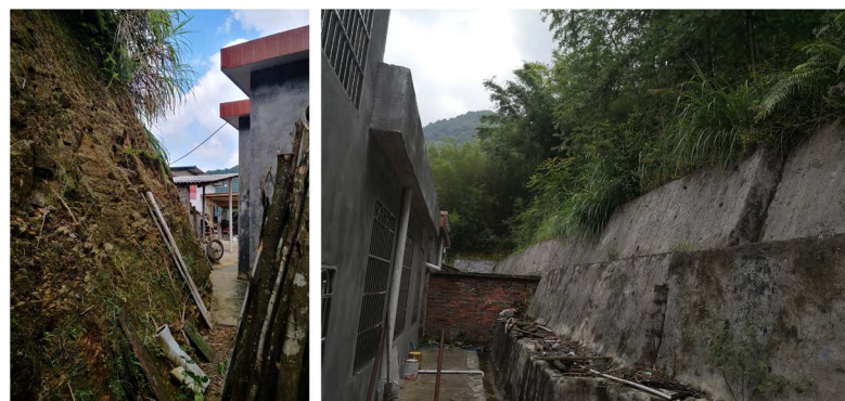
Figure 3. Field investigation photos of slope cutting and building construction (left: Not reinforced; right: Reinforcement) 图 3. 外业调查削坡建房情况照片(左: 没加固削坡建房点; 右: 加固削坡建房点)