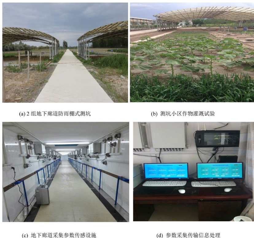
Figure 1. Underground corridor canopy irrigation test pit facilities 图 1. 地下廊道防雨棚式试验测坑设施