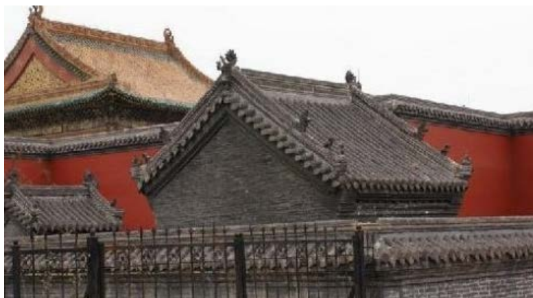
图 5. 沈阳中心庙 Figure 5. The center temple of Shenyang