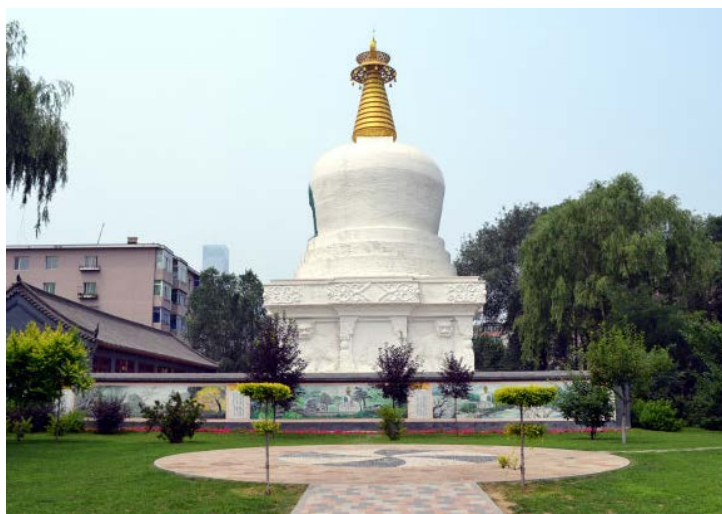
图 3. 沈阳南塔 Figure 3. Shenyang south tower