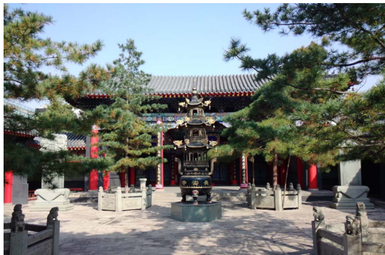
图 7. 沈阳长安寺 Figure 7. Shenyang Chang'an temple