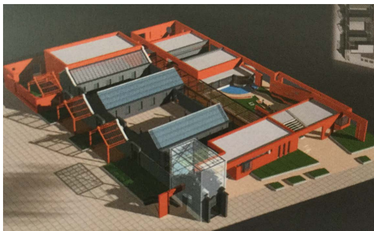
图 8. 中共满洲省委旧址陈列馆鸟瞰图

1) 与周围建筑风格不符，建筑群中人的视线多受到周围现代建筑干扰，置身其中不能得到古代合院建筑中应有的宁静感。这在现代城市中几乎不可避免——动辄百米的高楼出现在历史建筑的视线范围内。由于没有更多的退让空间，只能通过强制性的控制周围建筑高度、控制周边建筑形式等手段进行视觉处