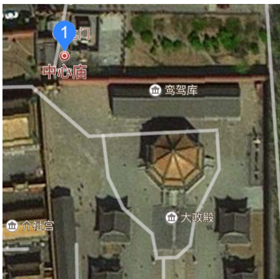
图 10. 中心庙与周边建筑的关系 Figure 10. Relations between the Center temple and surrounding buildings