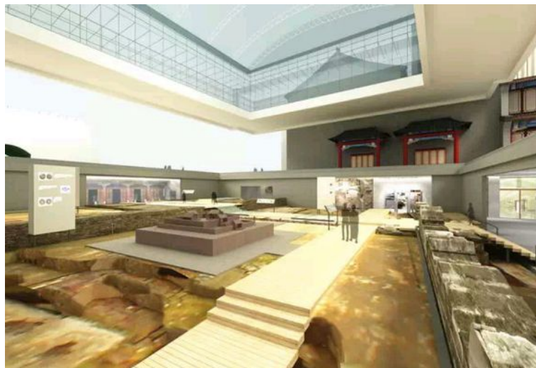
图 14. 沈阳方城内罕王宫遗址保护方案 Figure 14. Protection scheme of Hanwang temple site in Shenyang