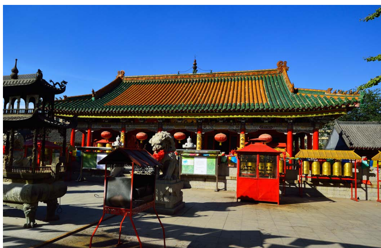
图 6. 沈阳实胜寺(清代皇家寺庙) Figure 6. Shenyang Shisheng temple (The royal temple in the Qing dynasty)