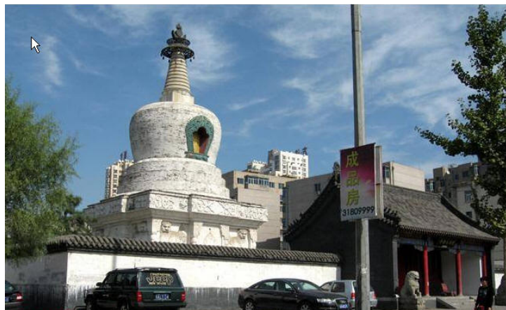
图 2. 沈阳西塔 Figure 2. Shenyang west tower