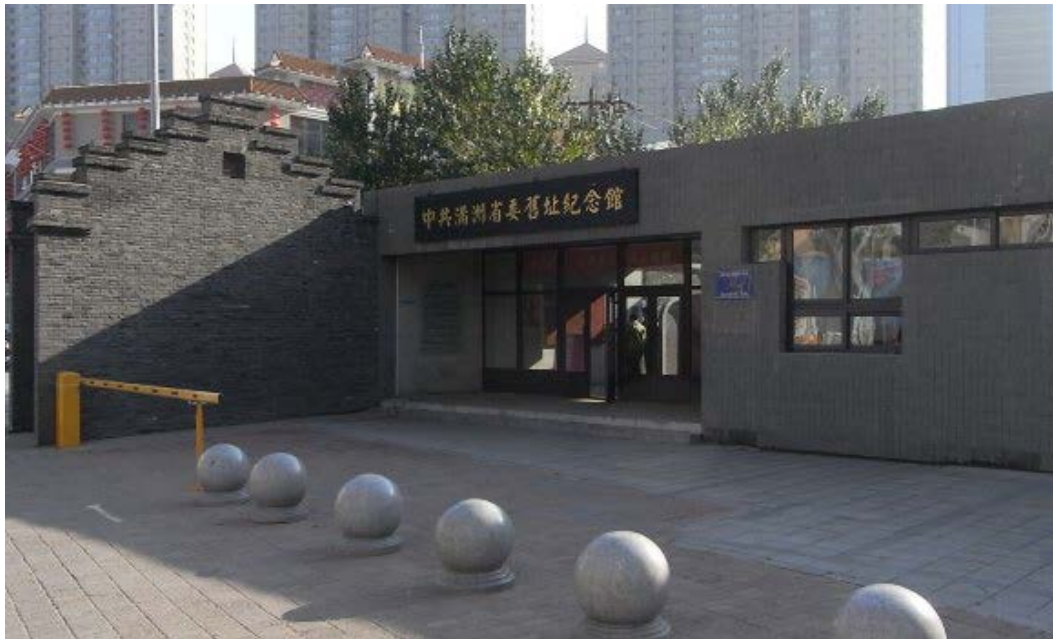
图 9. 中共满洲省委旧址陈列馆入口