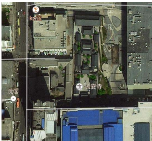
图 11. 长安寺与周边建筑的关系 Figure 11. Relations between Chang'an temple and surrounding buildings