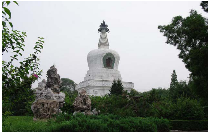
图 1. 沈阳东塔 Figure 1. Shenyang east tower