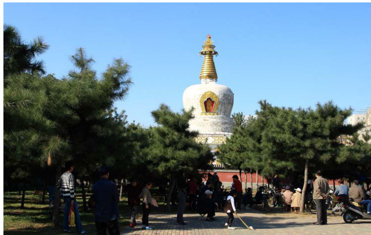
图 4. 沈阳北塔 Figure 4. Shenyang north tower