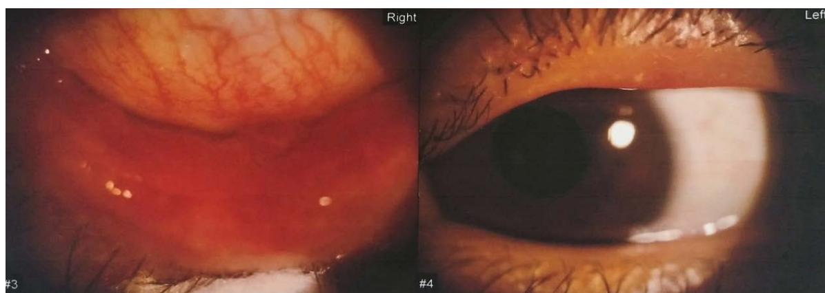
Figure 1. Preoperative anterior segment photography of this patient: palpebral conjunctiva and bulbar conjunctiva are hyperemia, several conjunctival proliferators, boundaries clear, no purulent secretions were found on the surface 图 1. 患者术前眼前段照相: 睑结膜、球结膜充血, 数个结膜增生物, 边界清晰, 表面未见脓性分泌物)