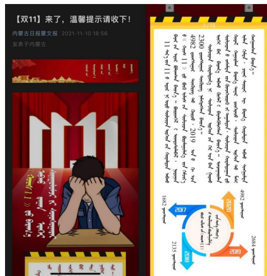
Figure 4. 图 4.