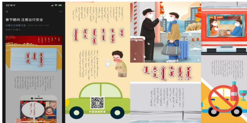
Figure 3. 图 3.

集信息指引、节假日提示、政策指引等主题宣传。内蒙古日报蒙文报微信公众平台 2022 年 2 月 6 日发布长图新闻《春节期间注意出行安全》(见图 3), 采用了浓郁的中国风的设计, 唯美的制作出, 出行前做好规划, 尽量缩短在候车室等人群聚集场所的时间; 倡导优先通过互联网等方式购票; 准备好防护物品以及抗原检测报告等内容, 有效增强了新闻宣传的吸引力。2021 年 11 月 10 日, 内蒙古日报蒙文报新媒体推出长图新闻《[双 11]来了, 温馨提示请收下!》(见图 4), 通过漫画形象, 从亲朋好友的视角劝解理性消费的重要性, 不仅说服力强, 而且制作精美。