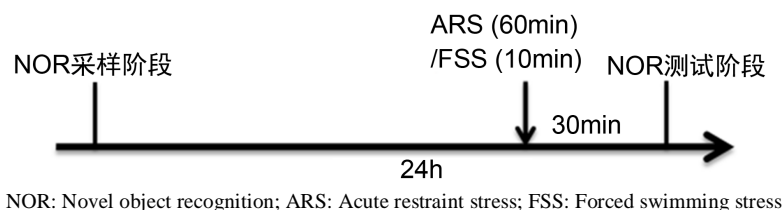
Figure 1. Schematic of the experimental design

实验将小鼠随机分为对照组, 急性束缚应激组和强迫游泳应激组, 每组 10 只, 在 NOR 采样阶段结束后 24 h 进行测试阶段, 在测试阶段前 30 min, 急性束缚应激组小鼠束缚 60 min, 强迫游泳应激组自由游泳 10 min。在采样阶段, 观察并记录小鼠对两物体的总探索时间; 在测试阶段, 观察并记录小鼠分别对新旧物体的探索时间, 并计算出总探索时间和辨别指数; 观察并记录小鼠在两阶段的活动度(见图 1)。