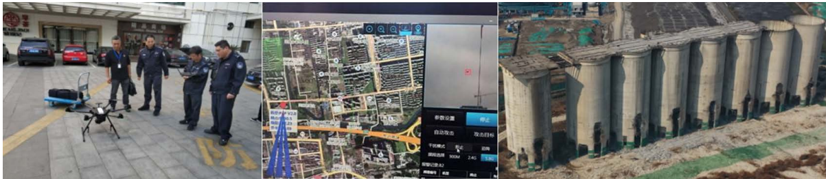
Figure 2. UAV supervision of construction site safety 图 2. 无人机施工现场安全监管