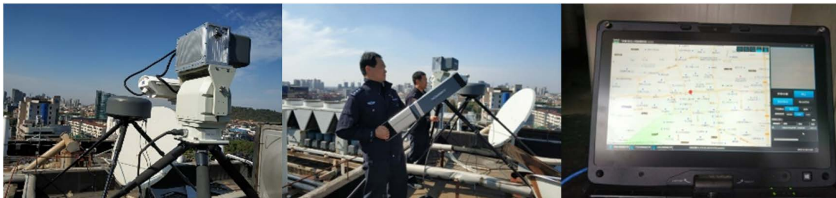
Figure 3. Field simulation of UAV countermeasure technology 图 3. 无人机反制技术现场模拟演练