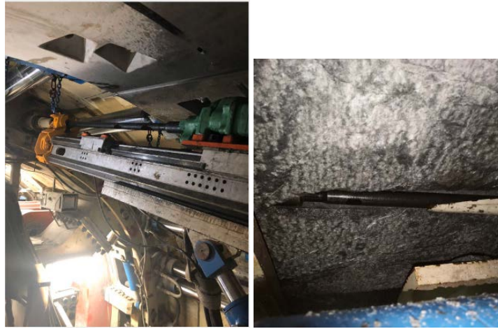
Figure 3. The application of advanced driller in jobsite 图 3. 超前钻机工地应用

数和出渣情况判断地层仅有局部破碎，且基本没有裂隙水，施工方据此判断无需进行超前注浆。因此，超前支护系统仅验证了钻孔功能，并未实际应用其超前注浆功能，但是施工方认为注浆设备和工艺是非常成熟，双护盾 TBM 配套的超前支护系统可以满足工程应用，顺利通过了性能验收。