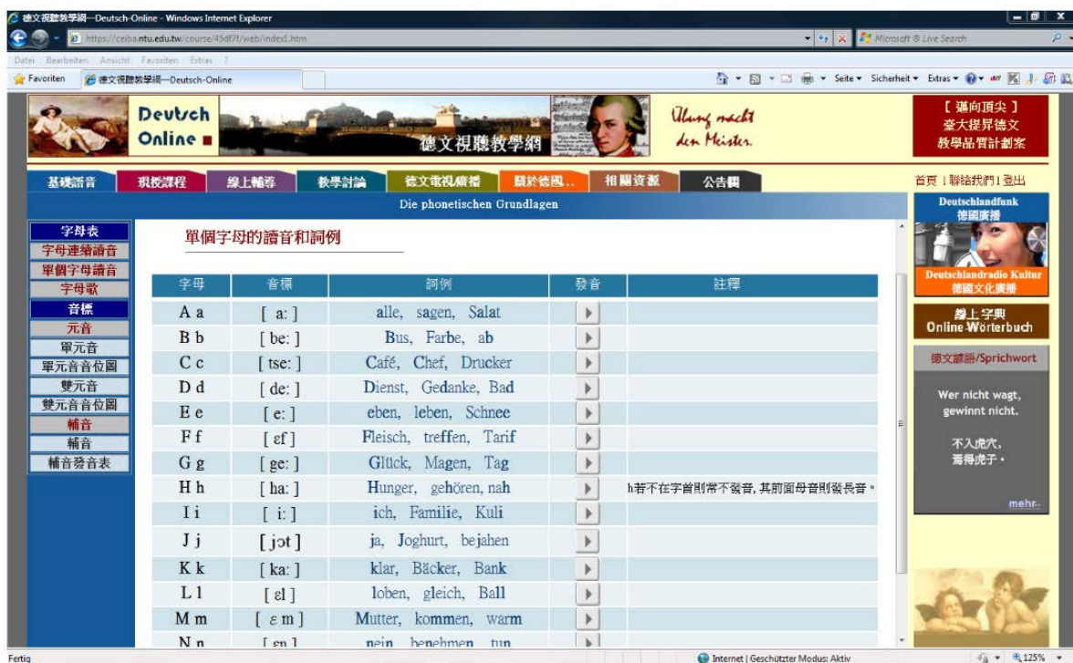
Figure 2. Screenshot example of German language teaching website: phonics 图 2. 德语教学网站网页截图示例：基础语音

情境中，便能加速德语的进步[4]。另外，修课学生也可藉此与母语专业人士探讨德国国情与地方文化，增加学习乐趣与动机。